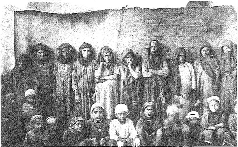
פליטות יהודיות מתימן בעדן

רוב יהודי עדן מתגוררים בבתים שירשו מאבותיהם ולאחרונה עלה מס הבתים לגובה של תשעה אחוזים, שהינו פי ארבעה ויותר מן המס הקודם, שאף הוא היווה נטל כבד על בעלי הבתים.