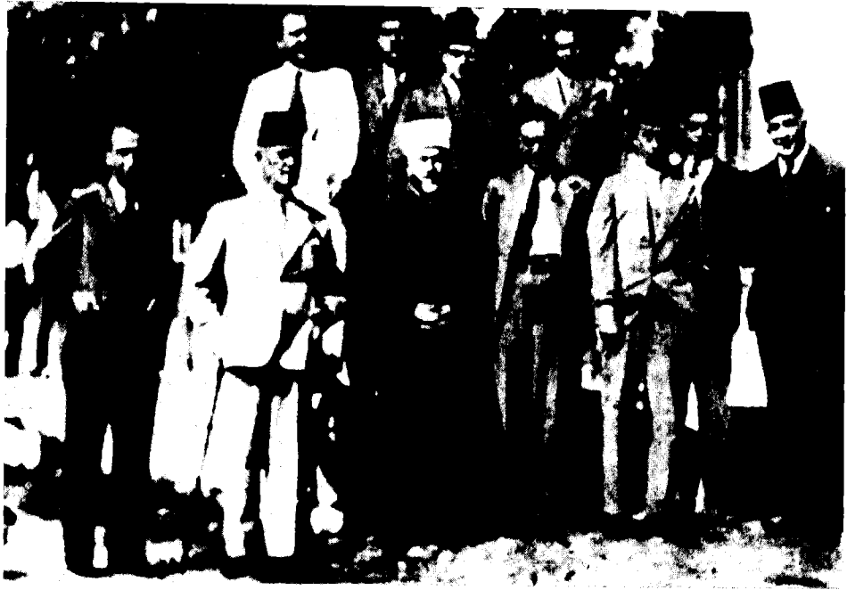
חברי הוועד הערבי העליון (המופתי במרכז) עם נורי אס-סעיד (ירושלים, אוגוסט 1936)

מקמייקל בקבלת ההחלטה לשלוח את ניוקומב לעיראק וממילא גם לא חיווה דעתו בנושא. 23 אל-חאג' אמין הפך, כידוע, לגיבורם של הממשלה ודעת הקהל הפוליטית בעיראק. הוא זכה למעמד ציבורי איתן ולתמיכה כספית שופעת, ואף היה לגורם מרכזי בפוליטיקה הפנים-עיראקית. הוא קשר קשרים עם ממשלות גרמניה ואיטליה, וניסה לחדש את המרד בארץ-ישראל. 24 לקראת סוף שנת 1940 הגיעו גם אנשי משרד החוץ למסקנה, כי נוכחותו ופעילותו של המופתי בעיראק אכן היוו סכנה לאינטרסים הבריטיים. בחוגים שונים של הממסד הבריטי נשקלו אז רעיונות לחטוף את המופתי או לחסלו. אף-על-פי שמשרד החוץ הבריטי התנגד להן בתוקף — מחשש שאל-חאג' אמין ייהפך לקדוש מעונה, והדבר יסב לבריטים נזק מרובה — הודה גם שר החוץ, הלורד האליפאקס, שמותו של המופתי הוא אכן פתרון רצוי. 25