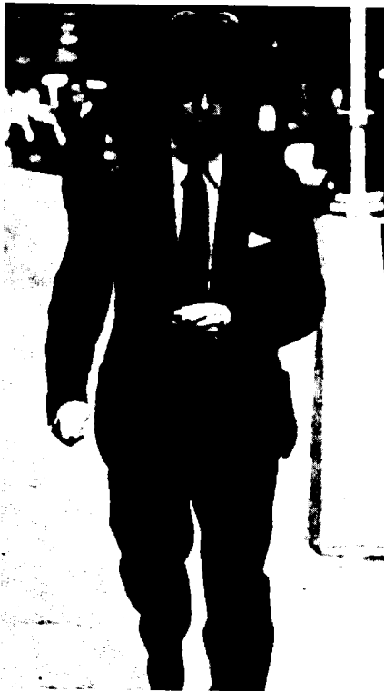
שר המושבות מלקולם מקדונלד

בשום מקרה. כבר בשלב כה מוקדם הביע באורח חד-משמעי את דעתו, כי מוטב שלעולם (never) לא יותר לאל-חאג' אמין לשוב לארץ.