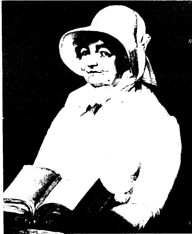
ג'זאנה סאוד'קוט (1812)

ב'אותו חלק של הכנסייה שהיה עד כה החשוב והמבורך ביותר — שעל כן עליו לשאת גם באחריות הכבדה ביותר' כלומר — בפלג הפרוטסטנטי האוונגלי; עם תום עשיית השפטים תבוא אחרית הימים, 'עידן של חסד אוניוורסלי'; התגלותו השנייה של ישו תתרחש עם תחילתן של אלף השנים; התגלות זו צפויה להתרחש בקרוב מפני שתקופת 1,260 השנים, שעליה מבוסס לוח הזמנים התנ"כי, תחילתה בימי מלכותו של יוסטיניאנוס וסופה במהפכה הצרפתית, ובעת המהפכה החלה להישפך ארצה תכולתן של שבע קערות החימה מחזון יוחנן. 13 היה זה צפוי למדי שוועידה, שכה רבים ממשתתפיה היו חברים פעילים במיסיון אל היהודים, תקדיש חלק ניכר מזמנה לדיון בהמרת דתם של היהודים ובהשבתם לארץ־הקודש. המשתתפים עסקו באותותיה של אחרית הימים הקרובה ורבים מן האותות שמנו צוינו בפרסומים מיסיונריים שונים של אותם ימים. הם שאבו תקווה רבה מן הדגש ששמה הכנסייה על קבלת היהודים והכרה בהם ומן השינוי הצפוי ברגשותיהם של היהודים עצמם כלפי הנצרות והיחלשות עוינותם כלפי מסריה. 14 בשאלת סדרם של המאורעות שילוו את ניצורם של היהודים רווחה ההנחה שהשבתם של היהודים לארצם תבוא כשלב ראשון לפני חזרתם בתשובה, כפי שרמז הנביא יחזקאל. 15 בעיה נוספת היתה, כיצד ייקראו אותם יהודים מומרים, 'האם יהיו לנוצרים או יישארו יהודים'?