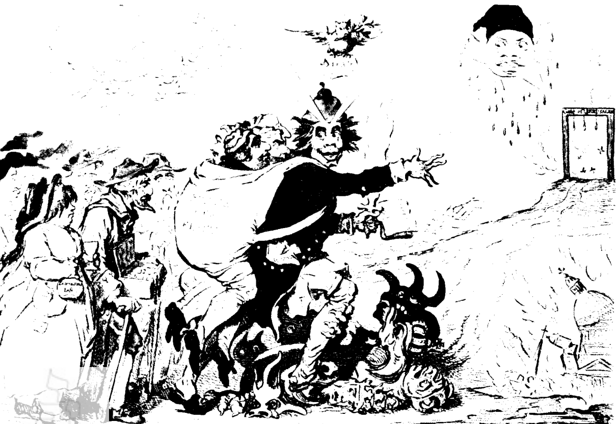
The PROPHET of the HEBREWS... the PRINCE of PEACE... conducting the JEWS to the PROMISED LAND.

— 'בניא העברים' — קריקטורה של ברדרס (1795)