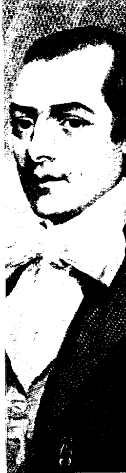
צ'רל ברדיס (1795)

לאור זאת ברור כי את היחס השלילי, שבו נתקלה הכמורה האוונגלית מצד עמיתה, ניתן לייחס לפחות בחלקו, לסגנונם חסר-המעצורים והקיצוני של כתות מילניאליסטיות קיצוניות יותר. על רקע סגנון זה נזרה הכמורה של הכנסייה האנגליקנית הממוסדת, והקפידה להרחיק ולסייג עצמה מהנהגים שאפיינו את המתנבאים המאוחרים. הכמרים האנגליקנים לא התנבאו בעצמם, לא פיתחו פולחנים או טקסים חדשים, ולא קראו לנוהגי אכילה מיוחדים או ללבוש מתבדל. הם לא שגו בחלומות, בחזיונות או בהזיות, והכרונולוגיות שכתבו והפיצו לא היו פרי השראה עליונה כי אם פרי מחקר אינטלקטואלי מפוכח.