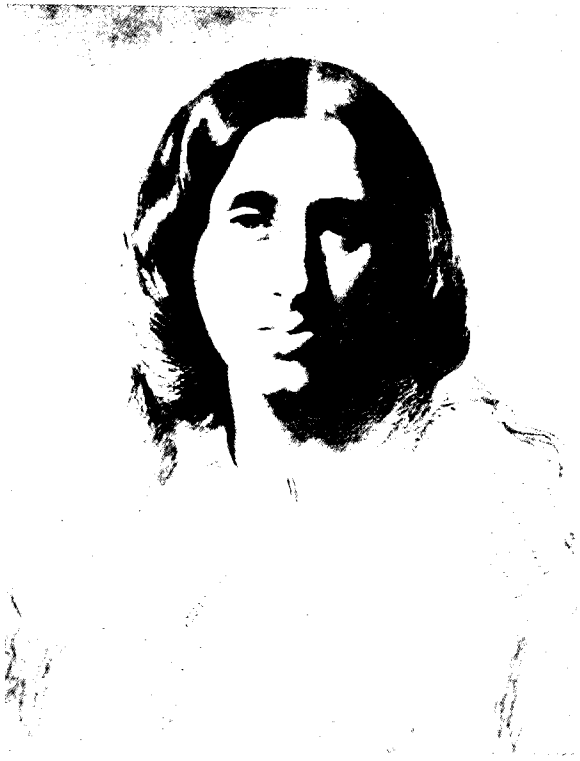
ג'ורג' אליוט (1860)