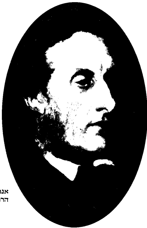
אנתוניו אשלי קופר, הרוזן שפטסברי

המאה הי"ט תפסה פרשנות ספרי הנבואה, ובמיוחד ספרי דניאל וישעיה בברית הישנה וספר חזון יוחנן בברית החדשה, מקום מרכזי בתאולוגיה האנגלית. כאשר אנו מעיינים כיום בספרות הדתית הענפה של התקופה, ניתן לנו להבחין בתהליך התפתחותה של תאולוגיה מסוימת, או מוטב, מערכת אמונות מסוימת, שהסבירה את מקומם של היהודים ושל ארץ-ישראל בהיסטוריה האלוהית. למרות הקושי להעריך במדויק את מידת השפעתה של מערכת אמונות הן משום שטבען ועוצמתן של אמונות אלה שונים מאדם לאדם והן בשל תפיסתה של הדת כעניין פרטי, אעסוק במאמר זה בתפוצתה של מערכת האמונות המסוימת לגבי הנבואה המקראית ובאופן שבו השפיעה ההתעניינות בנבואות על התגבשותן של ציפיות מסוימות כלפי העם היהודי וכלפי מאורעות שאמורים היו להתרחש בארץ-הקודש, ואנסה להראות כיצד נקשרו מאורעות היסטוריים, שהתרחשו בארץ באופן הדוק לקטעים מסוימים בספרי הקודש.