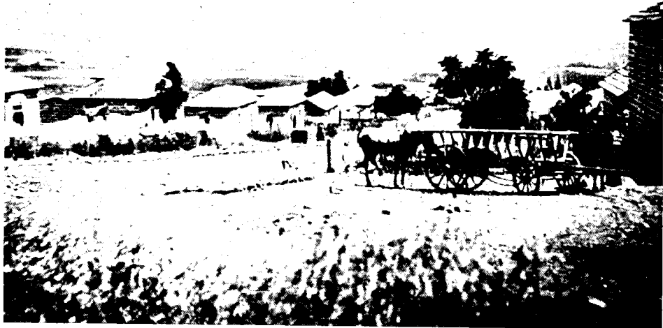
סגירה (תחילת המאה)