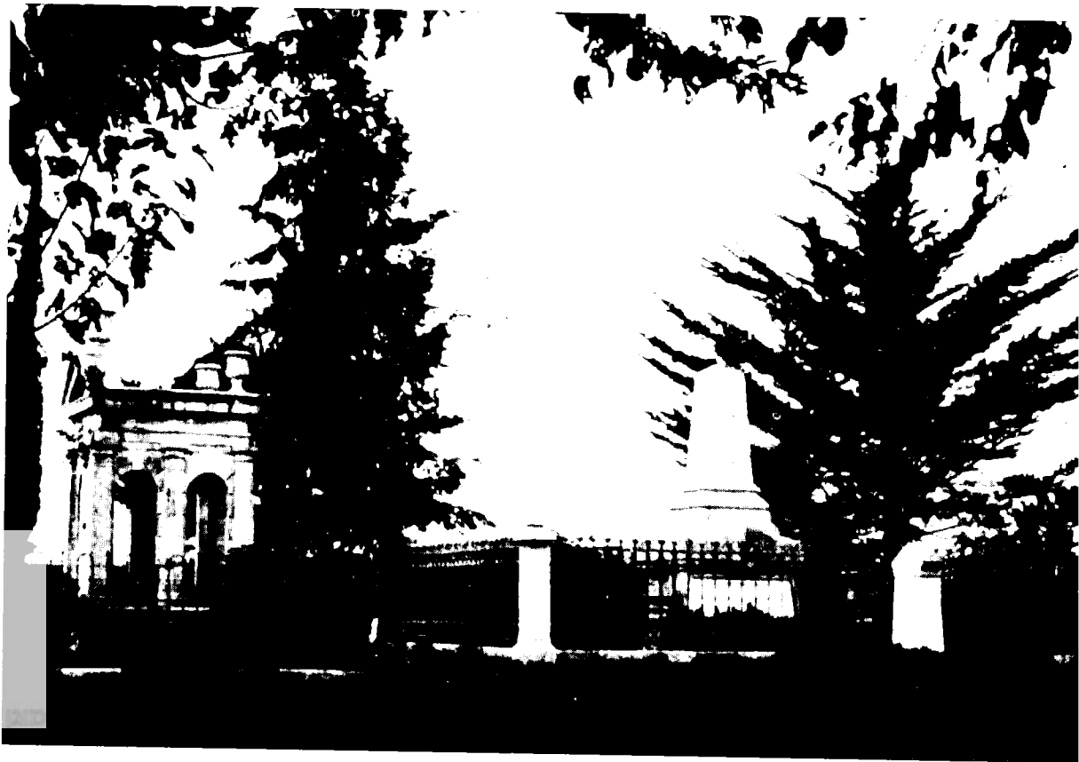
קברו של נטר במקווה- ישראל

חדשים, ואז צפויה היתה לצאת ממנה 'השכלה', כשם שבימי קדם יצאה ממנה התורה. 14 חקלאות נתפסה גם כפרנסה טבעית לבני עדות המזרח, שהיו עתידים, כך קיווה נטר, לעלות בהמוניהם לארץ-ישראל. 15 אין תימה אפוא שמקווה-ישראל היתה לבכת-עינה של אליאנס, ותוארה בדו"ח הארגון משנת 1878 בתור 'המוסד החשוב ביותר [שלו] להכשרה מקצועית, שעלה בקורבנות הרבים ביותר ומשך את תשומת-לב הציבורית הרבה ביותר'. 16