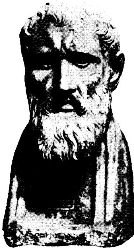
זֶנוֹן אִישׁ קִיטְיוֹן, מֵיִסְדֵר הַפִּילוֹסוֹפִיָה הַסְטוֹאִית. אֲנָשִׁי אֲסִכּוּלָה זֶה פִּעְלוֹ בְּאֲשְׁקִלוֹן

בארץ-ישראל עשויים לתרום תרומה של ממש לתולדות הארץ בתקופה האמורה. באנשי רוח מתכוון אני לנציגי התרבות היוונית הגבוהה — סופרים, פילוסופים, משוררים, רטורים וכיוצא באלה — אך גם למעבירי תרבות זו, מורים לדרגותיהם השונות. ככל חלוקה אף זאת שרירותית במידה מסוימת, ואינה מכלילה, במקרה של אשקלון, נושאים מובהקים של התרבות היוונית כגון השחקן אַפֶּלְס, שחקן הטרגדיה המפורסם ביותר במאה הראשונה לספירה, הידוע לנו, כמובן, בעיקר בשנאת היהודים שלו, 4 או את המתאבקים שבהם השתבחה העיר. 5 כן לא אכלול כאן אנשים, שידוע לנו רק על קשרי עקיפין שלהם עם התרבות היוונית הגבוהה, כגון הבנקאי העשיר פילוסטרטוס בן פילוסטרטוס, שהיה פעיל באי דלוס, שם מצויות שמונה-עשרה כתובות המזכירות אותו או את בני משפחתו. בין כתובות אלה מצויים שני שירים, בני תריסר שורות כל אחד, מפרי עטם של המשורר המפורסם אנטיפטרוס איש צידון ושל אנטיסטנס מפפוס; ניתן להניח שפטרוֹן