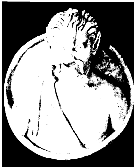
מדליון שיש מאשקלון ועליו דמותו של פאן (מחצית ראשונה של המאה השלישית לספירה)

בדברים, כי אם אמנה בקיצור את חיבוריו לפי סדר דיונו של מקסימיליאן באגה לפני למעלה ממאה שנה, ואלה הם: חיבור על הפרוסודיה ההומרית, חיבור בן חמישה-עשר ספרים על הדיבור היווני הנכון, חיבור על משקלי השירה, חיבור על συναλοιφή , חיבור על תיקוני אריסטרכוס באודיסאה, חיבור על הבדלי המלים, חיבור על הכת של קְרִיטֶס, ובנוסף לכך, כתב, לדברי לקסיקון ה'סוֹדֶה', חיבורים אחדים שאינם נזכרים בשמם. לבסוף, השאלה אם החיבור של פלוני פטולמיוס על הורדוס המלך נכתב על-ידי פטולמיוס איש אשקלון או על-ידי מחבר אחר בעל שם נפוץ זה היא עדיין בבחינת צריך עיון. 27 בין כך ובין כך, חשיבותו של פטולמיוס מאשקלון אינה נתונה בספק, והשפעתו על הפילולוגיה היוונית שלאחריו אף גדולה ממה שניתן להעריך על-סמך רשימת חיבוריו.