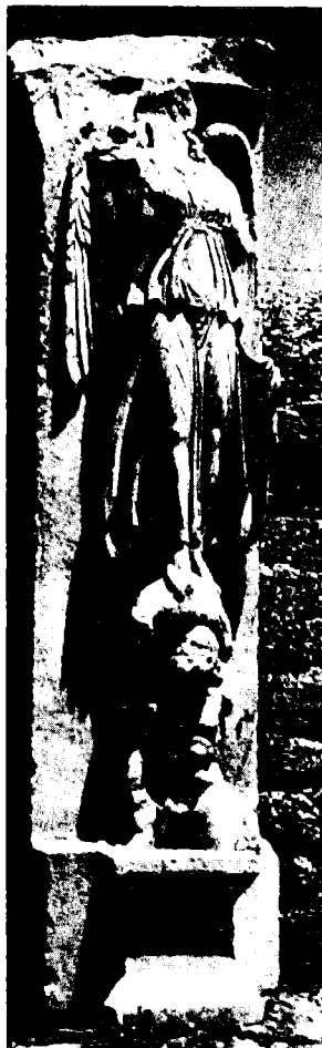
תבליטי ניקה, אלת הנצחון (כאן, וממול), מן הבסיליקה של אשקלון (התקופה הסטורית)

אנטיוכוס איש אשקלון ויורשו ב'אסכולה' שיסד היה אחיו של אנטיוכוס, אריסטוס; נראה שהיה צעיר באופן ניכר מאחיו, באשר מת כעשרים שנים אחריו. 19 אין מקרהו של אריסטוס מוכיח אלא את המובן מאליו, אולם עדיין אין אנו יודעים כמה פילוסופים, היסטוריונים, חוקרי לשון, אנשי ספרות ושאר אנשי רוח, שהיו פעילים באשקלון בתקופה הנדונה, לא נכללו ברשימתו של סטפנוס, וכמובן, אין אנו יכולים אף לנחש באיזה שלב משלבי המסורת נעלמו הידיעות על אישים שונים. אישיות אחרת בת אותה תקופה, שאולי בכוונה תחילה לא נכללה ברשימתו של סטפנוס, היא אֶאָנוֹס איש אשקלון. באוסף השירים הגדול, האנתולוגיה היוונית, מצויות אחת-עשרה אפיגרמות, המיוחסות למשורר, או משוררים, בשם אואנוס. אפיגרמות אלה שייכות ל'זר של פיליפוס', כלומר לאותו חלק של האוסף, הכולל את שיריהם של משוררים שפעלו בין שנת 90 לפנה"ס ל-40 לספירה בערך. 20 אואנוס מוזכר גם בשיר המבוא לקובץ של פיליפוס. באחד השירים מופיע ליד שם המחבר התואר 'גרמטיקון', באחד 'איש אשקלון', באחד 'איש אתונה', באחד 'איש סיציליה' וביתר אין ציון נוסף ליד השם. לדעת גאָו ופֶייג' אין להכריע בכמה משוררים מדובר. עם זאת, ראוי לציין שלטעמם המכתם בן שתי השורות, המיוחס במפורש לאיש אשקלון, הוא מן השנונים באוסף כולו. 21