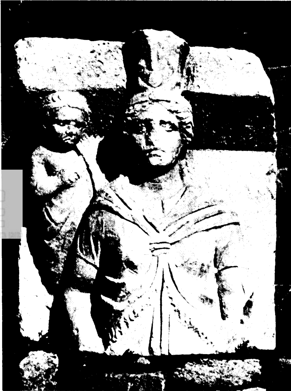
תבליט שיש של טיבה דמוית-איזיס מאשקלון