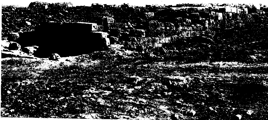
חורבת סוסיה: 'בניין המגן'