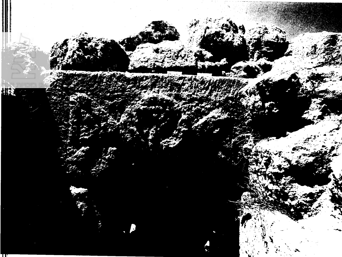
חורבת סוסיה: משקוף 'מערת המגורה', עליו חוקקה מנורה בתוך זר