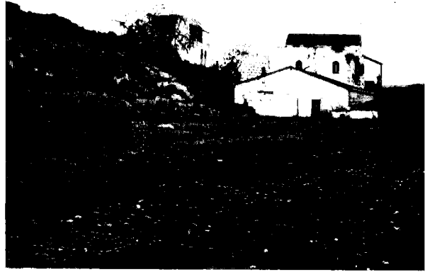
מתוך אלבום התמונות של אהרן אהרנסון – אכסניית באב אל-ואד (1904)