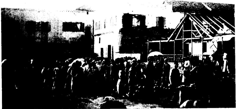
מתוך אלבום התמונות של אהרן אהרנסון – ביכר השוק בחיפה (1905)