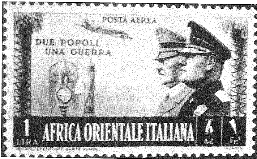
מוסוליני והיטלר על בול של המושבה אפריקה המזרחית האיטלקית, משנות המלחמה