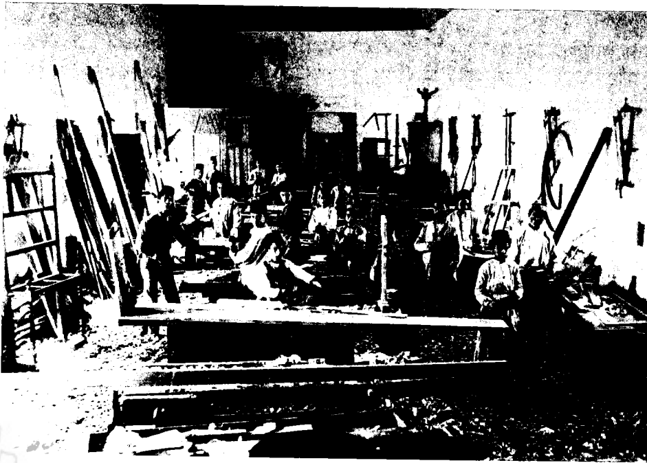
הנגריה בבית-הספר 'התורה והמלאכה'

גרסאות שונות. 30 הדעה הרווחת היא שעבד זמן קצר מאוד, ונאלץ לעזוב בשל מצב כריאונו שהלך והחמיר. בן-יהודה בזכרונותיו אינו מגלה דבר בעניין זה, ואילו רעייתו, חמדה, רומזת אמנם על מצב כריאותו שהלך ונתערער, ומציינת שהרופא ציווה עליו 'להניח את אומנות ההוראה', אולם, לפי דבריה, הוא המשיך במלאכתו. 31 מן המסמכים שבארכיון כ"ח מתברר, כאמור, כי בן-יהודה החל לשמש מורה לכל המאוחר באוגוסט 1883. במאמרו נגד מתקיפיו, 'ע"ד [על דבר] ההשקפה', מספר בן-יהודה עצמו כי הפסיק את עבודתו בסוף שנת תרמ"ה. כלומר, הוא עסק בהוראה במשך כשנה ומחצה. 32