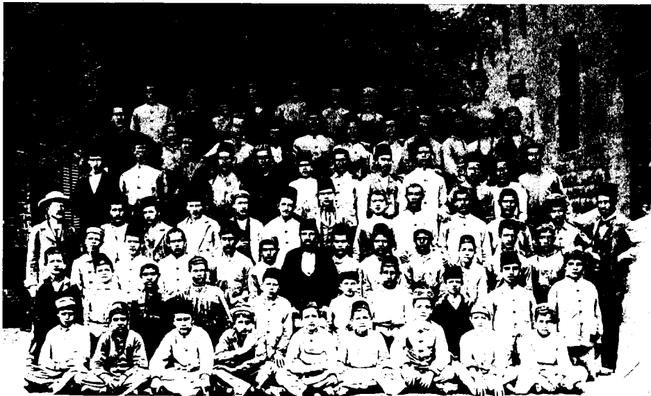
תלמידים ומורים של בית-הספר 'התורה והמלאכה'

באותה עת לערך הפסיק בן-יהודה את עבודתו כעורך בפועל של העיתון 'חבצלת' ומצבו הכלכלי היה ככי רע. 16 בכר הציע לו להצטרף אל צוות מורי בית-ספרו כמורה לעברית. צעדו של בכר נבע גם מן האינטרס שלו כמנהל — קירובם של בני המשפחות האשכנזיות המשכילות אל בית ספרו, שנשא באותה תקופה אופי של מוסד לילדים ספרדים בלבד. 17 בכר לא נטל על עצמו סיכון מבחינה פדגוגית, משום שהוראת העברית לא היתה מעלה או מורידה מיוקרתו של בית-הספר, ולמעשה, לכתחילה לא נכלל מקצוע זה בין מקצועות הלימוד. 18 מצד אחר היתה זו הדרך הטובה ביותר לסייע כלכלית לידיד, שמצוקתו היתה גדולה, מבלי לפגוע בכבודו. פנייתו של בכר אל בן-יהודה והסכמתו של האחרון מפתיעות במידת מה, שהרי דעותיו השליליות של בן-יהודה כלפי חברת כ"ח היו ידועות לבכר, כשם שהיו מוכרות לציבור קוראי 'חבצלת' הירושלמים. 19 יתר-על-כן, בכר אף היה מקורב ביותר אל אגודתם של יחיאל מיכל פינס ובן-יהודה, 'תחיית ישראל', שנועדה בין השאר להיות חלופה או סניף לחברת כ"ח, חברת-האם של בית-הספר 'התורה והמלאכה'. 20 אלא שבכר מיאן לוותר על שירותיו של בן-יהודה. הוא היה מודע,