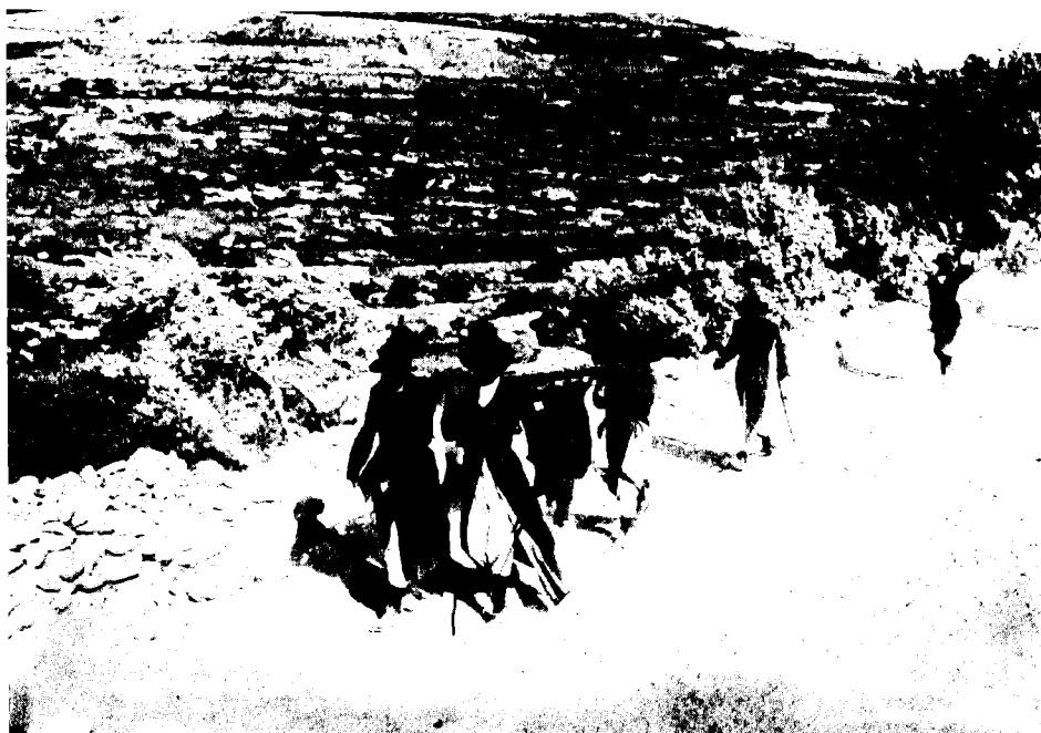
לווייה בירושלים, מצילומו היחידות האוסטרליות בארץ- ישראל (1918)

ההפקדות הפרטיות מפותחות במפתח DRL. כדי להגיע למידע המצוי בסדרה זו יש לזהות שמות של אנשים הקשורים בפעילות צבאית, אשר הם או יורשיהם הפקידו חומר בארכיון. בדרך זאת מצאתי חומר הנוגע לטייסים אוסטרליים שפעלו בארץ; תעודת בר-מצווה, שהעניקו שבויים אוסטרליים בשבי היפני לחברם היהודי, במועד שבו עלה בנו לתורה במלבורן (וכן גם את מאמרו של המחבר על תצלומי-האוויר בארץ במלחמת-העולם הראשונה, שפורסם ב'קתדרה' 7).