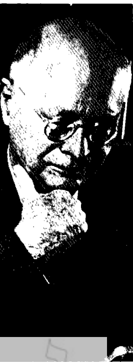
ויליאם פוקסוול אולברייט (1891-1971)

אולברייט אינו מביא שום ראיה לכך שיש לייחס את חורבנה של בית-אל בסוף המאה הי"ג למעשי מלחמה, על אחת כמה וכמה לכך שיש לייחס אותו לבני-ישראל. הבנאות של שכבות תקופת הברזל הקדומה מתוארת כגסה מאוד, בהשוואה לזו של העיר הכנענית הקודמת, והקרמיקה כמנוטוטנית, חוץ מן הטיפוס המכונה 'שפת הצווארון' (collared rim), האופייני למאה הי"ב לפנה"ס. כל זה מסייע לקבוע את זמנם של שלבי תקופת הברזל הראשונים בבית-אל. אבל בנאות גסה ו'שפת הצווארון' אינן עדות ברורה ליישוב ישראלי. 16 אולברייט היה משוכנע כי 'המסקנה הברורה והבלתי נמנעת' שלו חלה גם על יריחו, וכי הממצאים שלו בבית-אל מחזקים את האפשרות שהחורבן של שכבה C בתל בית-מרסים כשריפה גם הוא מתייחס לכיבוש הישראלי. וזאת על-אף שסבר שיריחו הכנענית נפלה בין 1375 ל-1300 לפנה"ס, כלומר לפחות חמישים שנה לפני חורבנה של בית-אל מתקופת הברונזה המאוחרת. ממאמר שפרסם אחרי-כן על הארכאולוגיה ותאריך הכיבוש התברר שטענתו מבוססת על קבלה בלתי ביקורתית של הסיפור המקראי. 17 באותה עת ביקר מרטין נות את חוסר הביקורתיות כלפי התיאור המקראי, אבל אולברייט בתשובתו רק חזר על ראייתו הארכאולוגית. 18