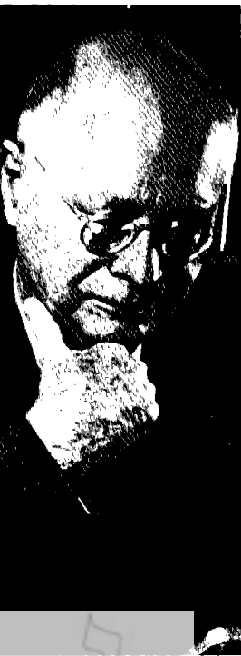
ויליאם פוקסוול אולברייט (1891-1971)

אולברייט אינו מביא שום ראיה לכך שיש לייחס את חורבנה של בית-אל בסוף המאה הי"ג למעשי מלחמה, על אחת כמה וכמה לכך שיש לייחס אותו לבני-ישראל. הבנאות של שכבות תקופת הברזל הקדומה מתוארת כגסה מאוד, בהשוואה לזו של העיר הכנענית הקודמת, והקרמיקה כמנוטוטנית, חוץ מן הטיפוס המכונה 'שפת הצווארון' (collared rim), האופייני למאה הי"ב לפנה"ס. כל זה מסייע לקבוע את זמנם של שלבי תקופת הברזל הראשונים בבית-אל. אבל בנאות גסה ו'שפת הצווארון' אינן עדות ברורה ליישוב ישראלי. 16 אולברייט היה משוכנע כי 'המסקנה הברורה והבלתי נמנעת' שלו חלה גם על יריחו, וכי הממצאים שלו בבית-אל מחזקים את האפשרות שהחורבן של שכבה C בתל בית-מרסים כשריפה גם הוא מתייחס לכיבוש הישראלי. וזאת על-אף שסבר שיריחו הכנענית נפלה בין 1375 ל-1300 לפנה"ס, כלומר לפחות חמישים שנה לפני חורבנה של בית-אל מתקופת הברונזה המאוחרת. ממאמר שפרסם אחר-כך על הארכאולוגיה ותאריך הכיבוש התברר שטענתו מבוססת על קבלה בלתי ביקורתית של הסיפור המקראי. 17 באותה עת ביקר מרטין נות את חוסר הביקורתיות כלפי התיאור המקראי, אבל אולברייט בתשובתו רק חזר על ראייתו הארכאולוגית. 18