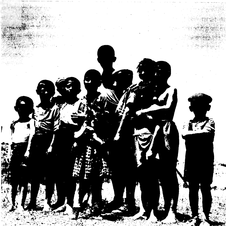
ילדים ניצולים במחנה עתלית (יולי 1944)

ואמנם, ישנו קושי רב, נפשי ומחקרי, בהצבת השאלות מן הכיוון הזה. מצד ההיסטוריונים היהודים נעוץ הקושי בכך שהם היסטוריונים של 'פוסט-ציוניזציה', כלומר הם שייכים לדור אשר — לאחר השואה ולאחר הקמתה של מדינת ישראל — עבר כבר את שלב האנטי-ציונות ונעשה לציוני, או שלא נזקק כלל לתהליך זה כדי להגדיר את מקומו בעולם ואת שייכותו לעם היהודי בקשר הדוק לקיומה של מדינת ישראל. לדורנו זה, בארץ ובארצות-הברית, קשה עד מאוד להציב שאלות בדבר השפעתה הפעילה והישירה של השואה על ההגשמה הציונית; שכן בין ההיפותוזות האפשריות לחשובה ישנן גם כאלה העלולות לעורר בעיות קיומיות ובעיות של זהות