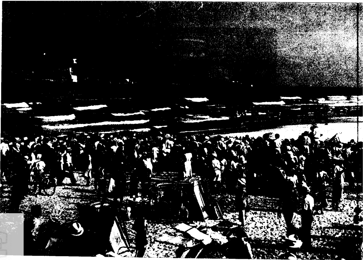
עולי 'פאריטה' מורדים לחוף, בנוכחות קהל תל-אביבי 22 באוגוסט 1939

אמת עם עצמו' אמר מאיר יערי בשנת 1943. 31 ההתמקדות בשאלת הצלת שארית הפליטה העניקה אפשרות להתחמק מעימות עם חוסר אונים זה, שמבחינתו של בן-הארץ, 'הישראלי החדש', היה כל-כך קשה.