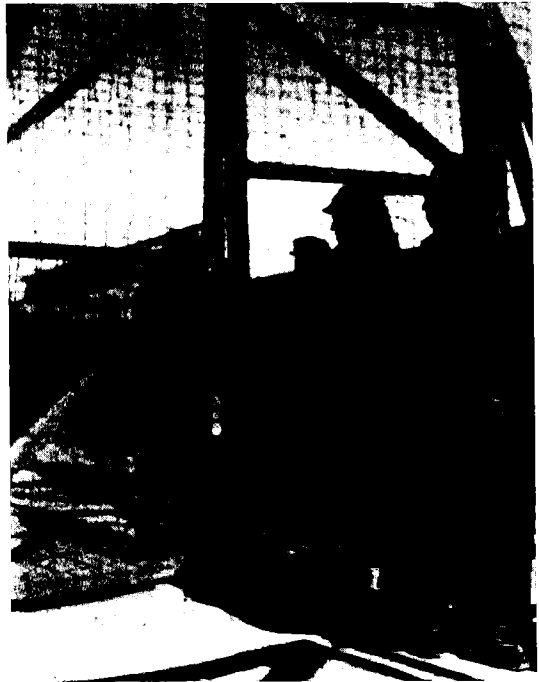
בשער מחנה העולים בעתלית (נובמבר 1944)

את בעיית ארץ-ישראל, שכן העלאת פליטים כה רבים תהפוך את היהודים בארץ ממיעוט לרוב, ותפתור את הסכסוך בינם לכין הערבים. 39