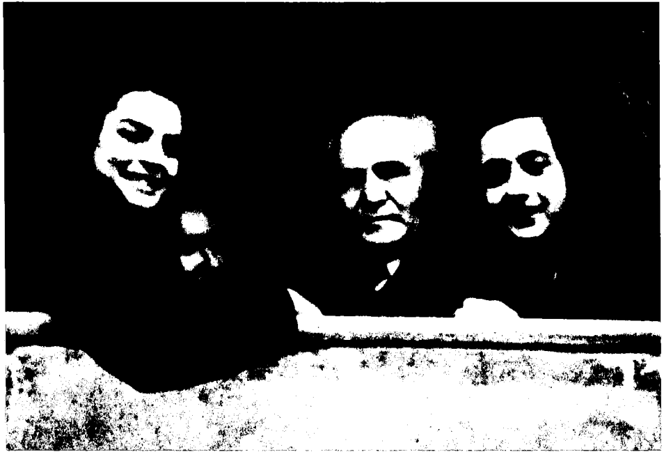
בן-גוריון ברכבת בדרך לבוולגריה (דצמבר 1944)