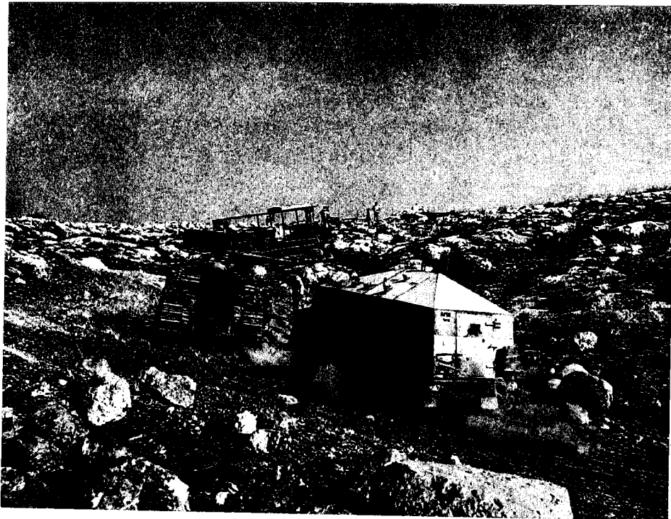
סוללים את ירושלים בירומה, יוני 1948

הפינוי הבריטי, ולקראת סוף החודש נקלעה ה'הגנה' למשבר במערכה בדרכים, משבר ושיירות בהנהגתו האישית של בן-גוריון פתח המטה הכללי של ה'הגנה' במבצע 'נחשון', וחולל מפנה במערכה במבואות ירושלים, ובאותה שעה הדפו הכוחות בצפון את 'צבא ההצלה' של קאוקג' ממבואות חיפה. מכאן ואילך המשיכו חטיבות ה'הגנה' ביוזמות התקפיות — לאור תוכנית ד' — בעודן מתארגנות לקראת הפלישה הבינ-ערבית הצפויה. חטיבת הפלמ"ח 'הראל', שהלכה והתארגנה בפרוזדור ירושלים, חברה למגינים בלחימה בתוך העיר. אנשי הפלמ"ח פעלו לשפר את מערכי המגן מצפון לעיר, אך לא הצליחו לחבור אל נווה-יעקב ועטרות. הם הצליחו לפתוח את הדרך להר-הצופים, אף כי הצבא הבריטי מנע את היאחזותם בשיח' ג'ראת. בדרום העיר הצליחו לכבוש את מנזר סן סימון ולהחזיק בו, וניצלו את ההצלחה לכיבוש קטמון. בינתיים שוב נחסם הכביש הראשי, אחרי קרב עם המאסף של שיירה גדולה ב-20 באפריל. ולאחר הקרבות בעיר נערכו מתחילת מאי שני מבצעים — 'מכבי א' ו'מכבי ב' — לביסוס הפרוזדור ולפתיחת הדרך, והשתתפו בהם חטיבות 'הראל' ו'גבעתי'. הפרוזדור חווק, בעיקר עם כיבוש בית-מחסיר (כיום בית-מאיר), מדרום לכביש. אולם הכביש לא נפתח עד הכרזת העצמאות.