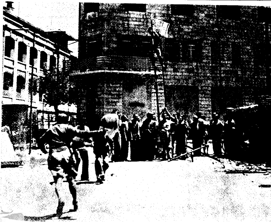
כוחות ה'הגנה' נכנסים לאזור הבטחון במרכז ירושלים ('בוינגרד'), 14 במאי 1948