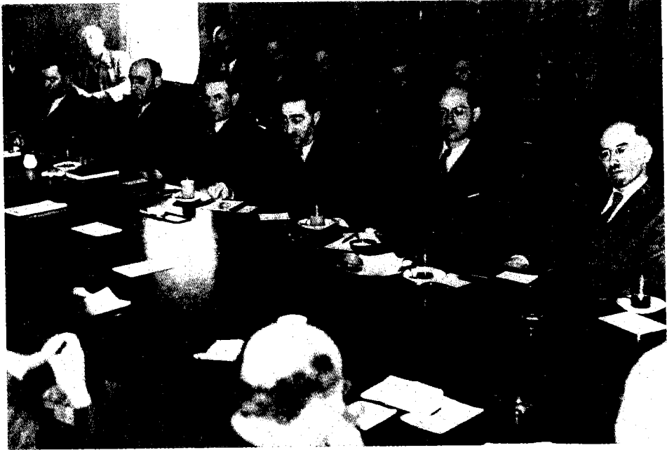
ועדת המוסדות לענייני ירושלים, בראשותו של דב יוסף (שלישי מימין)

את החוק הישראלי בירושלים, וב-1 באוגוסט אישרה את מינויו של דב יוסף כמושל צבאי בעיר, למן יום המחרת. כך ניתנה למעמדו המוכר בעיר גושפנקה מטעם ממשלת ישראל, בעת ש'סיפחה' את חלקה העברי של העיר למדינה. 31