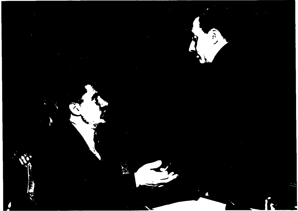
משה שרתוק משוחח עם תת-שרי-החוץ אנדריי גרומיקו, לייק סאקסט, מאי 1948

הקדושה'. 24 האם היתה זאת בקשה-קריאה 'מן המיצר' או קריאת תיגר? דומה ששתי הנימות נכרכו בדברים, אולם לימים נתן שרת עצמו לקטע את הכותרת: 'היפקיר או"ם את ירושלים?' 25 מכל מקום, היה בטיעונו משום מתן צידוק למאמץ הבלתי-נלאה של היהודים להגן על עצמם בעיר, לפרוץ דרך אליה ולחברה לשפלה בקשר בל-יינתק. 26