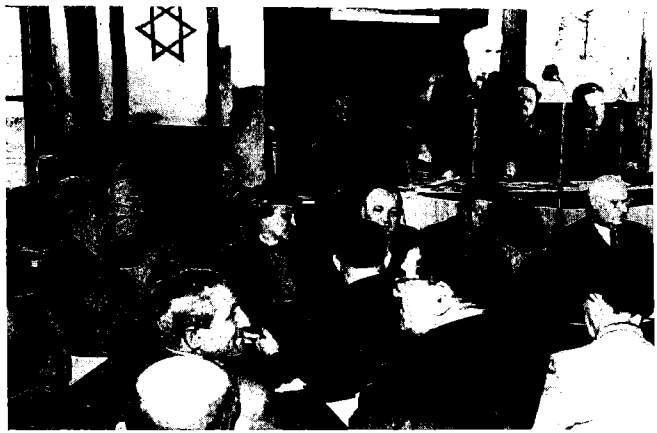
בן-גוריון בוועידה הציונית הראשונה לאחר סיום מלחמת-העולם השנייה (לונדון 1945)

וראשונה בהכשרת עילית מצומצמת ונבחרת. כעניין זה העמדה בה נקט 'הקיבוץ המאוחד' בפועל היתה דומה לעמדת 'השומר הצעיר'; שתי התנועות התנגדו בתוקף להצעת מפא"י להקמת 'החלוץ האחד'. חזית משותפת זו, שבאה לידי ביטוי בריון שנערך לקראת אישור ההצעה, נוצרה אף-על-פי שעמדותיהן העקרוניות והמוצהרות של שתי התנועות בשאלת העלייה ההמונית היו שונות לחלוטין; אלא שדה-הפקטו שבנקין ו'הקיבוץ המאוחד' קיבלו במידה רבה את עמדת 'השומר הצעיר' בזכות עלייה סלקטיבית ונבחרת. עמדתם המשותפת בסוגייה זו לא נבעה רק מקונויקטורה פוליטית. 52