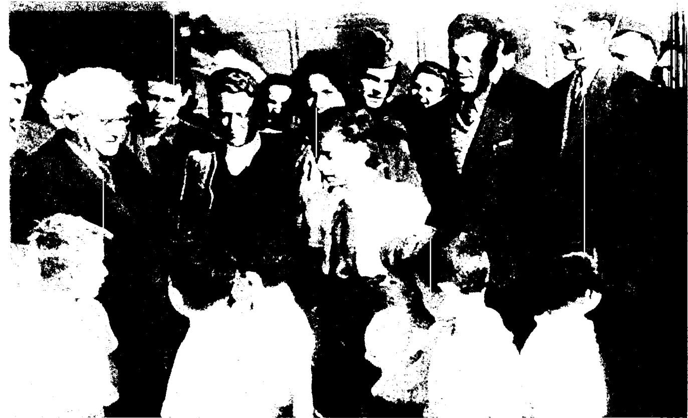
בן-גוריון מבקר במחנות העקורים בגרמניה

הוצאת ילדים ממחנות הפליטים והעברתם הזמנית לצרפת להחליש את המאבק לעליית כל הפליטים לארץ ישראל. 7