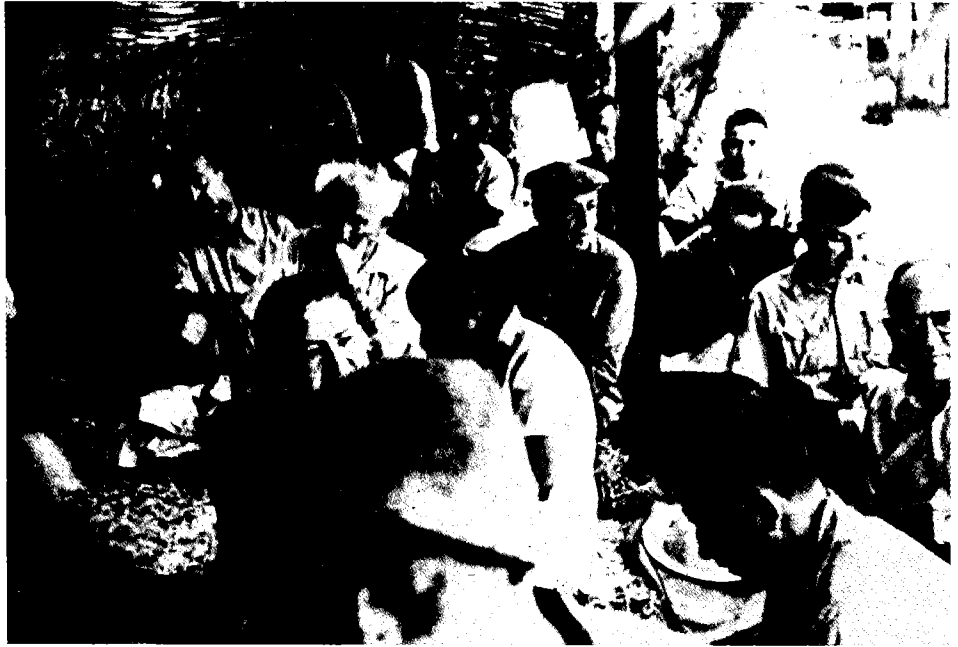
מועצת ההסתדרות באיילת-השחר (יולי 1943). במרכז – בן- גוריון ולשמאלו – טבנקין

אפוא משמעות רבה לא רק כשלעצמה, אלא גם מבחינת המאבק הציוני. בראשית 1943 אמר בעניין זה: 'מה בצע במלחמה ובנצחון אם עד תם המלחמה אירופה תהיה בית קברות יהודי'. 23 ניתן לראות במשפט זה ביטוי, נדיר למדי, של כאב ושל תחושת אובדן, 24 אך ניתן לראות בו גם קביעה, כי התכנית המדינית הציונית, שהנצחון במלחמה היה תנאי הכרחי ומרכזי בהגשמתה, תאבד את כל ערכה ומשמעותה, אם אחרי המלחמה לא ייוותרו יהודים באירופה.