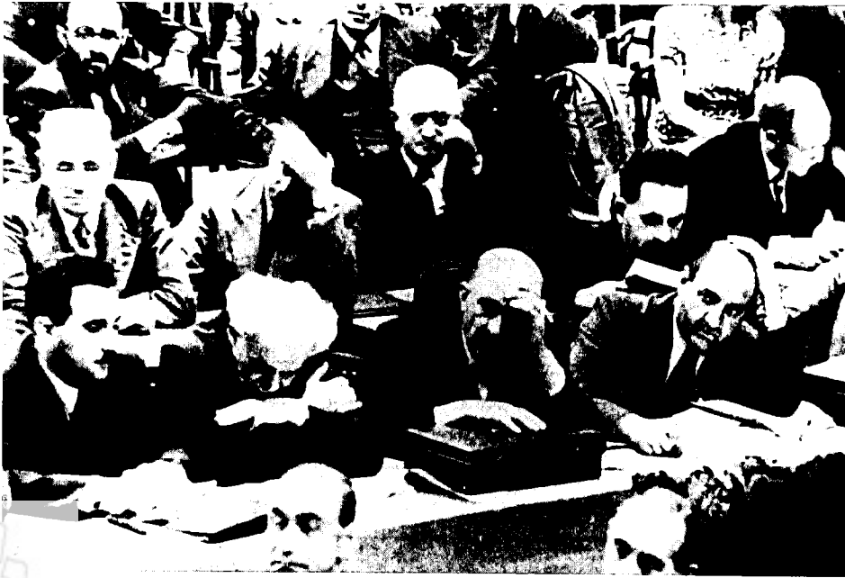
ישיבה בקונגרס הציוני הכ"א, שבמהלכו פרצה מלחמת העולם השנייה (גינבה, תחילת ספטמבר 1939). בשורה השנייה (מימין לשמאל): אליעזר קפלן, חיים וייצמן, דוד בן- גוריון, משה שרתוק

התעלמות מהבעיה הלאומית... [משמעה] חתירה תחת אשיות הציונות ופיתוי שכל ציוני חייב ללמד את עצמו לדחותו מכל וכל. 4