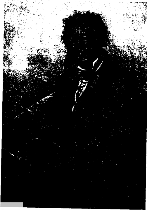
מרדכי עמנואל נח (1851-1785)