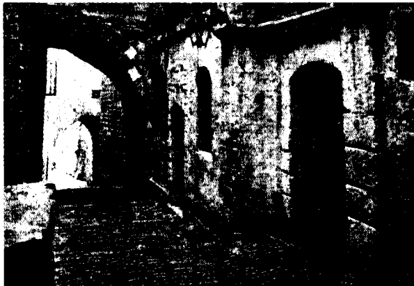
בית-הספר למל, חארת-אל-שארא, בחלק המזרחי של שכונת היהודים