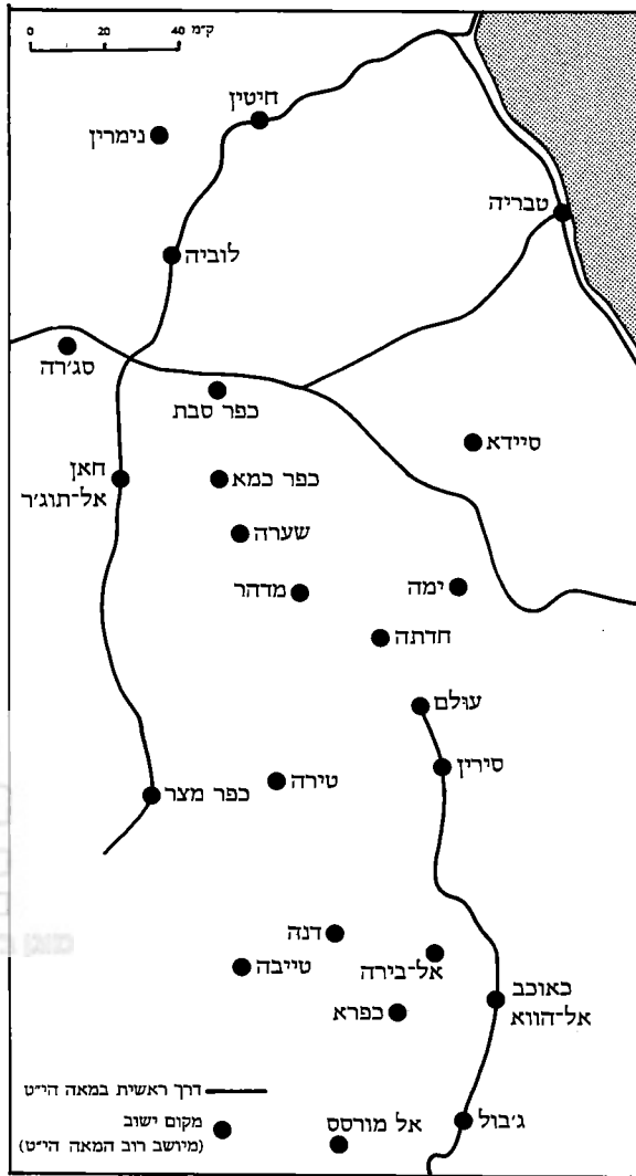
יישובים בגליל התחתון המזרחי בסוף המאה הי"ט