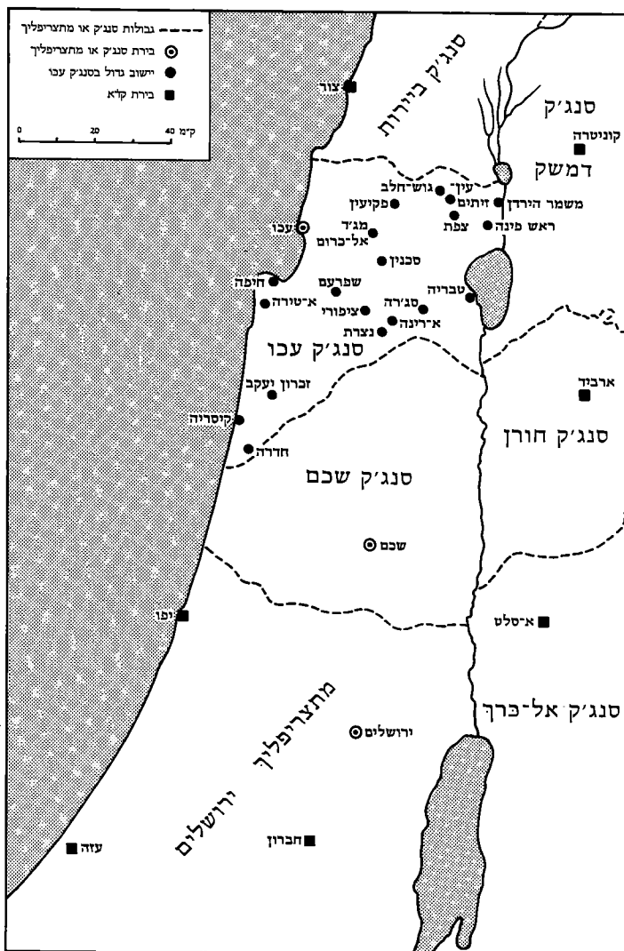
ארץ-ישראל וסנג'ק עכו ב-1900

יהודית בארם-נהריים, כשם שהוד רוממותו הואיל להציע לי בפברואר האחרון, בתוספת הטריטוריה של חיפה והסביבה בארץ ישראל. 21 בינתיים עלתה הצעת אל-עריש, ונדמה היה כי סנג'ק עכו נשכח במשך כל שנת 1903. אולם במרץ 1903 נפגשו שליחי הרצל, הרמן שטרוק וד"ר אדולף פרידמן, 22 עם קלוורסקי בנצרת. השניים נשלחו מטעם 'הוועדה הארץ-ישראלית', שנבחרה בקונגרס הציוני השני ותפקידה היה