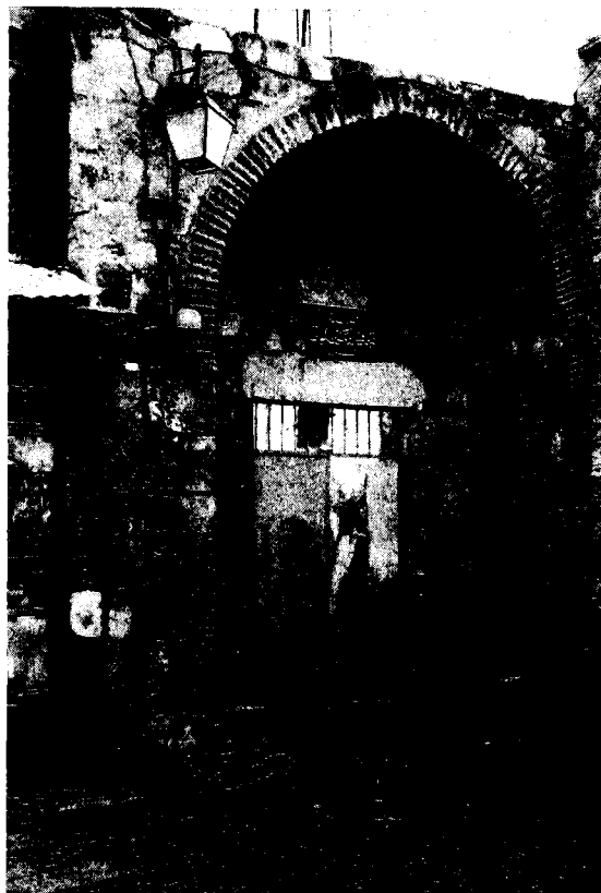
פתח הכניסה לזאווייה ממלוכית (כיום מסגד השיח' לולו באזור שער שכם, העיר העתיקה, ירושלים)