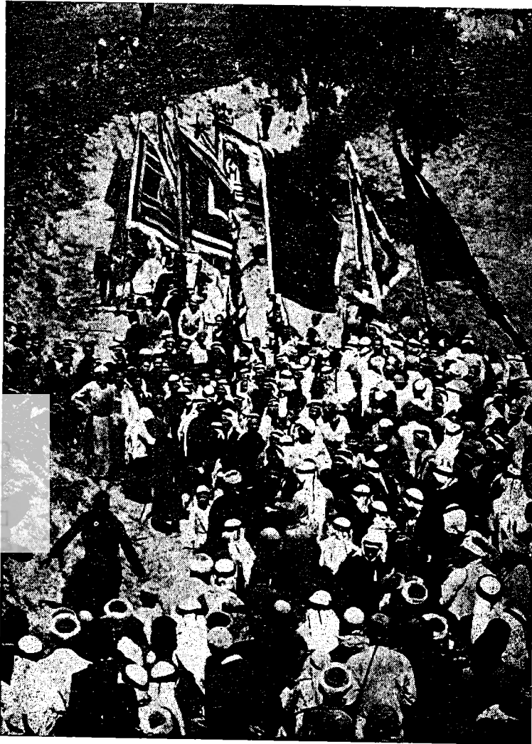
התהלוכה המסורתית לנבי מוסא

ואכן לא תמיד למדו המרידים של אלבכרי את תנאי הכנסתם למסדר כחברים מלאים בקלות וללא תקלות. היו מקרים, שבהם חש השייח' כי הכשרתם והכנתם של תלמידיו לא הושלמה די הצורך והם אינם מוכנים לעמוד בדרישות ובחובות המוטלות עליהם. במקרים אלה דחה אלבכרי את הבקשות להצטרפות לח'לותיה. כאן נסתפק בדוגמא אחת מביין אחדות המובאות בספר. נור אלדין מתמודד ביקש להצטרף למסדר. מצטפא אלבכרי, שחשש כי הוא לא ידע לשמור על סודות הח'לותיה ויבגוד, מנע ממנו את האפשרות להתקבל למסדר. 27 לבסוף הסכים האיש לקבל על עצמו את כל ההתחייבויות, 'אף אם יושיבוהו על גחלים לוחשות'. כך הוכנס נור אלדין למסדר תוך שהוא מצווה לשמור בקפדנות על הסודות ולא לגלותם ליש. 28