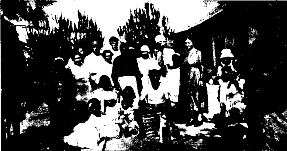
אנשי מושב השומרים תל-עדשים

פורטוגלי לא הסתפק בהצגת המושב כחזון רעיוני, אלא פירט גם את הצדדים המעשיים והטכניים הקשורים בהגשמתו – מקורות הפרנסה, אופן חלוקת הרווחים, הגידולים החקלאיים והדרך המעשית לשילוב השמירה והחקלאות.