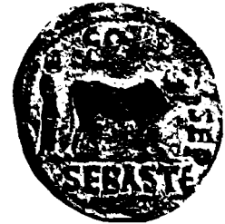
מטבע מסבסטי (מימי קאראקאלה) המתאר את ייסוד העיר