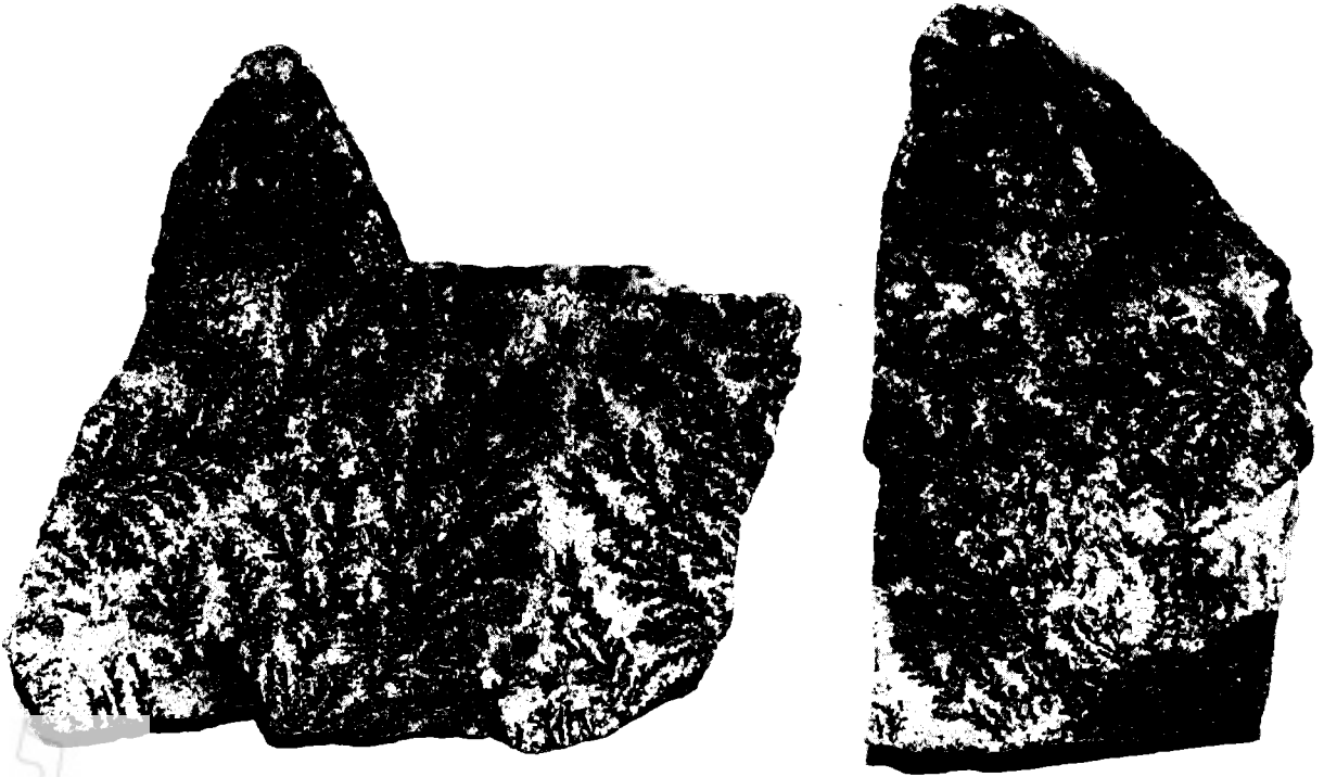
דנדריטים מסיני

הסבה רק מפני שאלו האבנים אם יבקעו כמה פעמים לעולם ימצא בהם צורת הסנה. וזה פלא גדול. 12