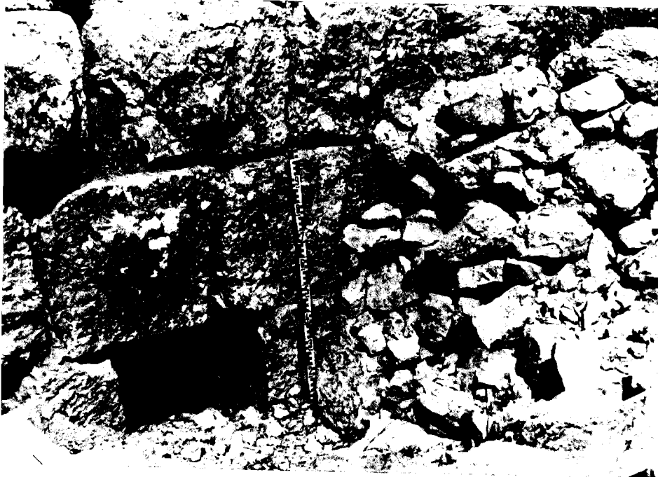
למעלה: בור א', בנפח של כ-3,000 מ"ר. למטה: פינת קיר מסי 7. אבנים בעלות סיתות-שוליים אופייני בגובה מספר נדבכים