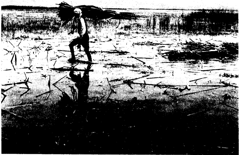
איסוף גומא בביצות החולה

לזרוע דרכו. 6 על נסיון דומה שנעשה בשנת 1897 מוסרת בתזכיר משנת 1900 החברה Société Agricole de Houleh, שטיפלה בנושא הזכיון. 7 בשנת 1900 הוסיפו עוד קשת לגשר בנות-יעקב, והדבר השפיע על ירידת מיפולס הביצות. בשנים 1904-1905 נעשו נסיונות להעמקתו של אפיק הירדן, צפונית לביצות. 8 נסיון מעניין להתוויית תכנית כוללת לייבוש הביצות נעשה על-ידי מהנדסים גרמנים, כנראה בשירות התורכים, במלחמת-העולם הראשונה. 9 כל הנסיונות שנעשו בפועל הביאו אך לתזוזות זמניות וחלקיות בהיקף הביצות; שכן עניינן של כל התכניות האלה היה אך בצמצום הביצות. אפילו התכנית הגרמנית, שביקשה לפתור את בעיית הביצות באופן מקיף ויסודי, גם היא עסקה בייבוש הביצות בלבד. התכנית המקפת הראשונה, שעוסקת בכל ההיבטים של הבעיה — ייבוש הביצות, ניצול כוח הידרולוגי, ניצול לחקלאות ולתעשייה — הינה התכנית הנדונה של ציוני ארצות-הברית. מתעוררת אפוא השאלה, איך קרה שדווקא גורמים ציוניים-אמריקניים הגו תכנית כה מקפת וכוללת לפתרון בעיותיו של עמק החולה, זמן כה קצר לאחר כיבוש של הארץ על-ידי האנגלים, ובטרם נקבע גורלה המדיני.