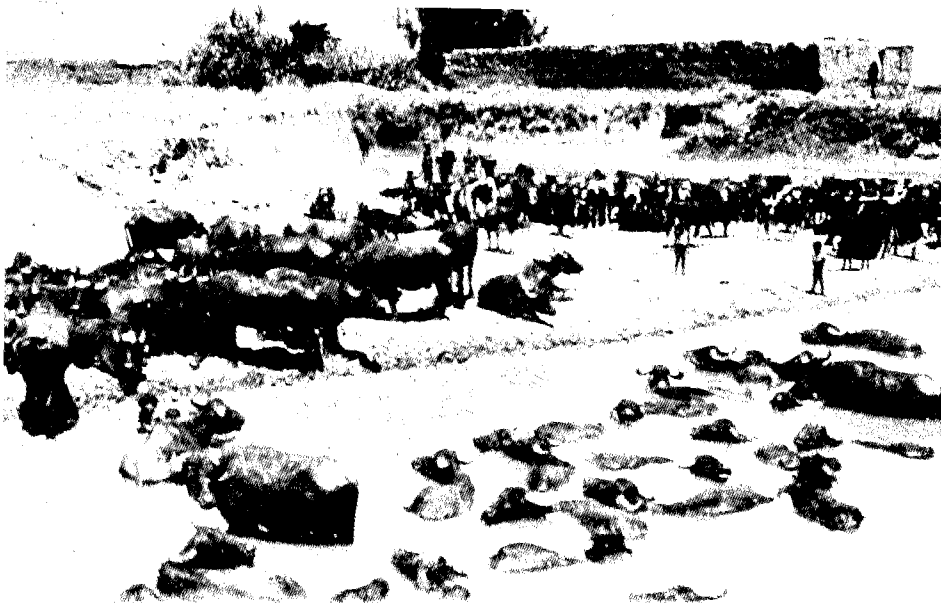
ראשי-תאז (צ'מוסים) בצאלחיה, על שפת אגם החולה