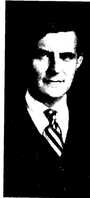
ג'ון ג' ויננט (1889-1947), שגריר ארצות-הברית בבריטניה בשנים 1946-1941

בריטניה ואמריקה במלחמה העולמית (ההספד נישא לפני פרל-הארבור וכניסת ארצות-הברית למלחמה), ושהן ינהיגו הסדר עולמי חדש, שבמסגרתו ייעשה צדק עם העם היהודי. וכאן אנו חוזרים להקשר של נאום בן-גוריון. ההספד נאמר, כזכור, בעיצומו של מסע מדיני לארצות-הברית. ואכן, כעשרה ימים אחרי בואו של בן-גוריון ללונדון הוא נפגש שם עם השגריר האמריקני בבריטניה, ג'ון ויננט (John G. Winant). ויננט נכנס לתפקידו בתחילת 1941 (כיהן בו עד 1946) במקום ג'וזף קנדי, אשר נטה לקץ הפייסני ופגע במאמצים הציוניים בלונדון. 12 ויננט היה רפובליקני עצמאי, פרוגרסיבי, בעל זיקה למסורת המדינית של ברנדייס וודרו וילסון. הוא העריץ את פרנקלין רוזוולט, צידד בתחיקה חברתית מתקדמת ובמדיניות-חוץ בלתי-פייסנית. 13 כשנפגש בן-גוריון עם ויננט, ברנדייס היה עדיין בחיים ונזכר בשיחה (לפי דיווחו של בן-גוריון):