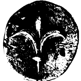
מטבע של פחוות יהוד (יהודה) בתקופה הפרסית

ואת מלכינו, שרינו, כוהנינו ואבותינו לא עשו תורתך, ולא הקשיבו אל מצוותיך ולעדותיך אשר העידות בהם. והם במלכותם ובטובך הרב אשר נתת להם ובארץ הרחבה והשמנה אשר נתת לפניהם לא עבדוך ולא שבו ממעלליהם הרעים. הנה אנחנו היום עבדים, והארץ אשר נתת לאבותינו לאכול את פריה ואת טובה — הנה אנחנו עבדים עליה. ותבואתה מרבה למלכים, אשר נתת עלינו בחטאותינו, ועל גויותינו מושלים ובכהמתנו כרצונם, ובצרה גדולה אנחנו. 4