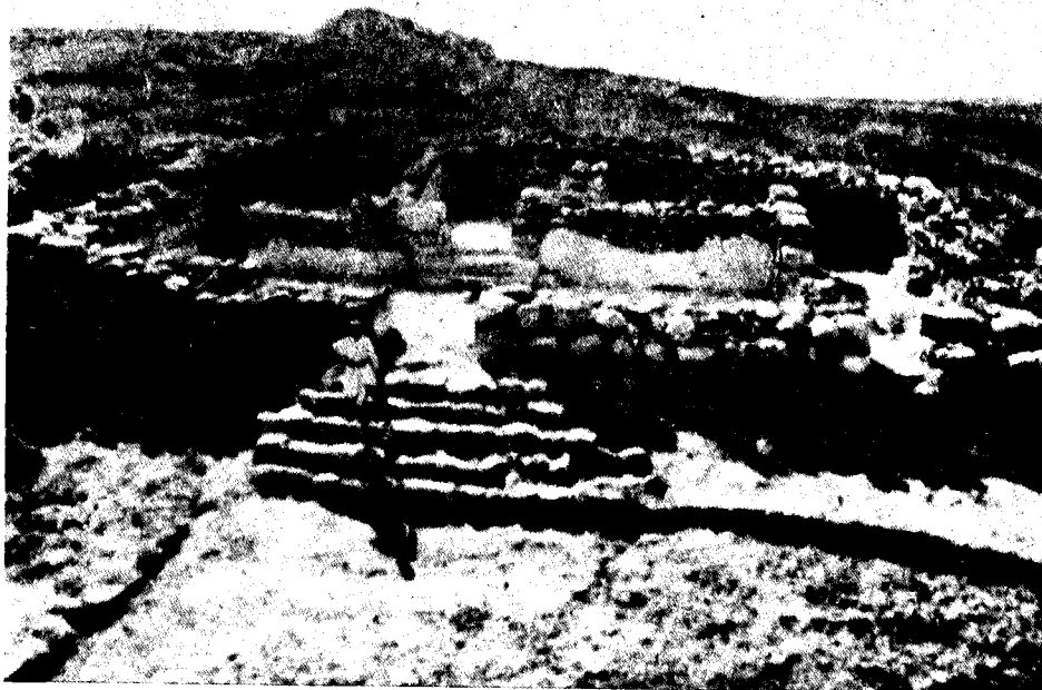
מקדש השמש בלכיש שמחוץ לתחום פחוות יהודה, התקופה הפרסית (מבט למערב)

עכור לרביץ בקר לעמי אשר דרשוני' (סה ט-י). כל הייעודים האלה בעניין ירושת הארץ סובבים על צירה של שאלה אחת – 'למי הארץ'; ובתוכם מובלעות טענותיהם של אנשי פחוות יהוד: זוהי נחלת יעקב אבינו (נח יד). היא נחמסה בידי שכנינו, וה' אוהב המשפט ושונא הגול (סא ח), השב ישיבנה אלינו.