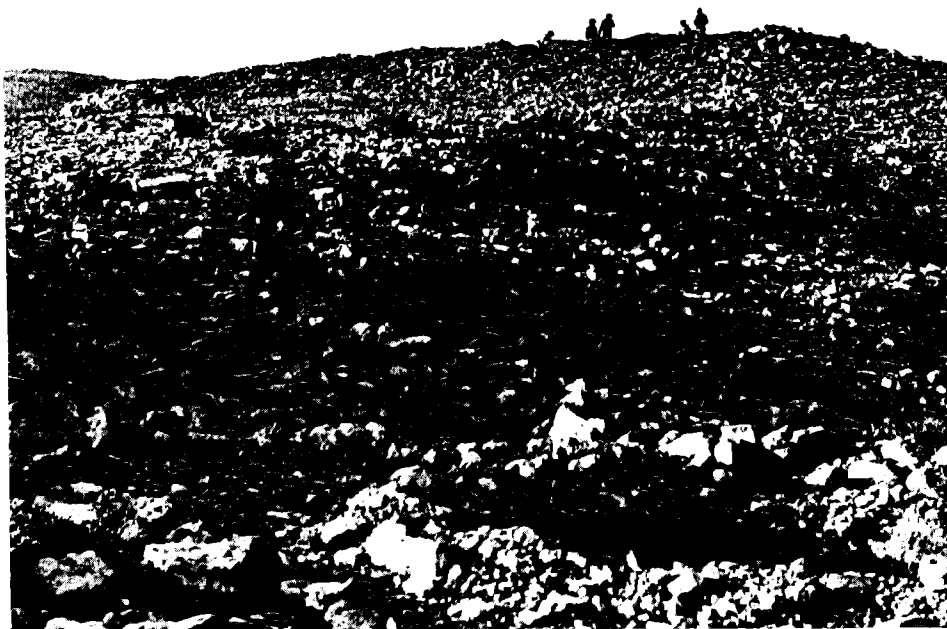
המצודה בחורבת רתמה

מספקים שעורים לפרשים, לסוסים ולחמורים'. נוה הדגיש את תפקידם האפשרי של פרשים וחמורים אלה 'כחיל מצב השומר על הדרכים... כחוליה במסגרת הרחבה של קיום התקשורת, הן בהעברת דואר דחוף והן בהובלת מצרכים ומשאות ליחידות צבאיות ולפקידות הממלכתית שישבה במקומות מרוחקים בנגב ובמדבר'. 21 אנו שמים את הדגש על תפקידם האפשרי במסחר. בהקשר זה יש אף לפרש את האוסטרקונים מתל אל-חליפה ומכאן דמיונם בחוכן לחרסי באר-שבע. עדות מעניינת לקיומה של דרך המסחר, המקשרת בין הדרום הרחוק והחוף הדרומי של ארץ-ישראל, נמצאה בחפירות האחרונות בתל ג'מה: כתובת דרום-ערבית על כתפו של קנקן שנמצאה בחפירת אסם. 22 החופרים נוטים אמנם לאתר את זמן האסם ומייחסים את הכתובת למאות הג'-הב' לפני הספירה, אך תאריך זה אינו מוחלט, אלא נסיבתי, ויש אפשרות שיוקדם בהמשך המחקר עד לתקופה הפרסית.