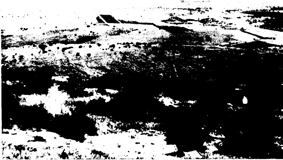
חורבת חוקוק, מראה כללי