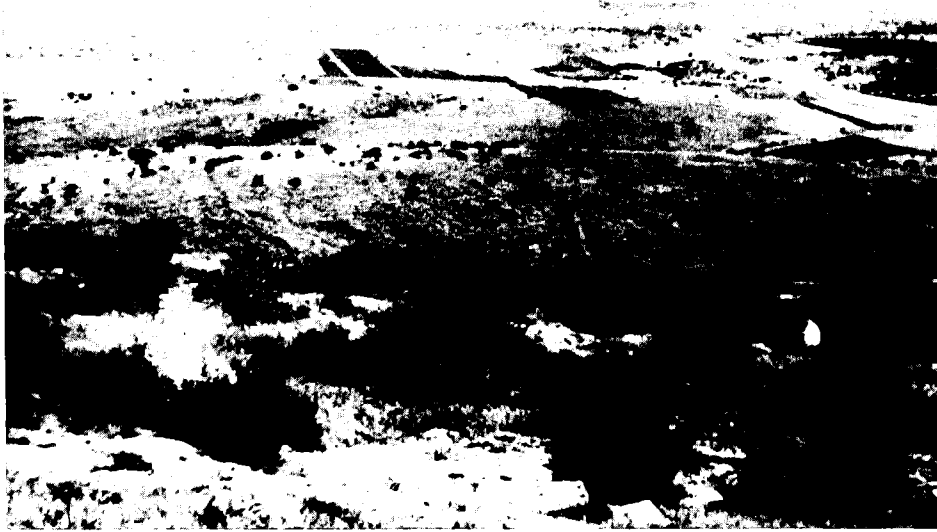
חורבת חוקוק, מראה כללי