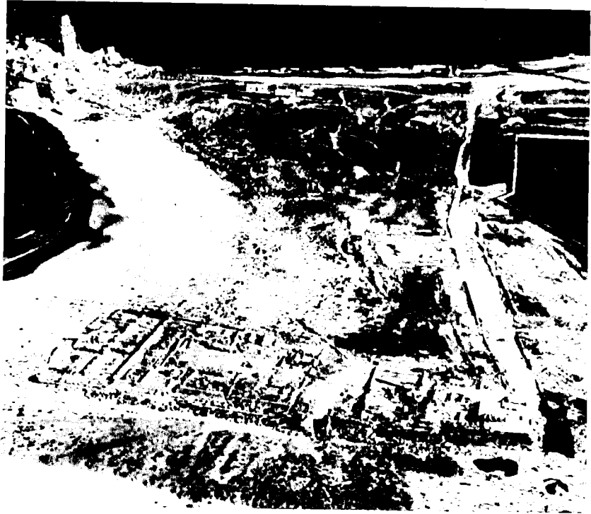
המצודה הצלבנית של עתלית ושרידיהם מאחרים יותר (תצלום- אוויר אלכסוני של חיל- האוויר הבריטי, 1936, מבט לצפון)

השבעים; וכל אותה עת היו לגביו ג'נין ולג'ון שוליים מבחינה כלכלית, ושכם חזקה מדי מבחינה צבאית. למרות כל זאת הוא התמיד במאמציו להגיע לכלל שליטה באזור של צפון השרון, וזאת משני טעמים: ראשית הוא ראה אזור זה כמקור נוסף להכנסות; ושנית — כחלק ממגמתו להבטיח שליטה בחיפה ובאגפיה. אשר לטעם הראשון, הרי בכך אין אזור זה שונה ביסודו מן האחרים, שבהם השתלטו דאהר ובני משפחתו על ארץ-ישראל; לאתר גילויי אכזריות מן הסוג שהוזכר לעיל, היו הפלאחים — בהעדר כל משענת צבאית — נאלצים לשלם לו כל מס והטל שתבע מהם. אשר לטעם השני, הרי לאחר שהפך לשליט כל הגליל וקבע את בירתו בעכו, השתדל דאהר במשך כל שנות החמישים להביא גם את חיפה תחת שלטונו. המושל של דמשק, שהתחזקותו של דאהר היתה לצנינים בעיניו, עשה לצמצם את כוחו זה, ובין היתר מנע ממנו בהוראת הסולטאן את חיפה. אחת הדרכים שנקט דאהר כדי להשיג את השליטה בחיפה, היתה ליצור לעצמו בסיס של כוח מדרום לה, באזור של חוף עתלית ואף מעבר לו. בשנות החמישים המאוחרות הוענק אזור זה בחכירה לכל ימי חייהם ('מאלפיאנה') לממונה ('מתנלי') על ההקדש ('נקף') של סולטאן באיזיד, סיד מצטפא ובנו סיד מחמד אסעד בכ. אלה, שמקום מושבם היה בוודאי באיסתנבול הבירה, האצילו מטעמם את זכות החכירה לדאהר עד לתחילת אוגוסט 1760. הוא, מצדו, פרע כדין את התשלומים המגיעים ממנו ('בדלי-אלתזאם') ואף לא גילה — לדברי אחד הצוויים של הסולטאן — כל מרדנות. 2 כנראה שדאהר הוסיף למשול שם עוד שנת-כספים אחת או שתיים (1174-1175 / 1760-1762) מטעמם, בין אם בזכות הנזכרת דלעיל ובין אם בלעדיה; 3 ומכל מקום, המושל של