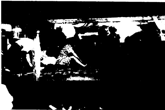
בתוככי 'אף-על-פיכך', ספטמבר 1947