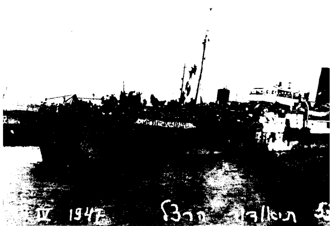
אוניית המעפילים 'תיאודור הרצל', אפריל 1947

ויקיים את הקשרים הפוליטיים הכרוכים בהעפלה, כמו משא-ומתן עם אישי-מימשל בארצות השונות. 52