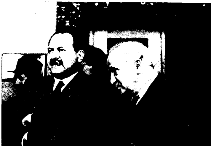
משה סנה ודוד בן-גוריון, ירושלים 1946

באיטליה או פרשת 'אכסודוס' 64 . נחרצותו של 'המוסד' בפרשות אלו, כמו גם בפרשות רבות אחרות, קבעה את מהלכי ההנהגה המדינית; בעוד שבן-גוריון סבר, כאמור, שהתהליך חייב להיות הפוך.