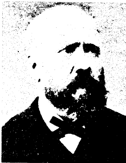
אדריאן בונפיס (1861-1929)