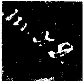
החתימה M.J.D. בפינת התצלום של עין-רודגל (הגדלה)