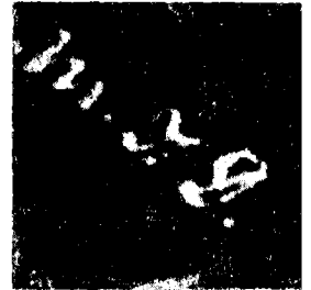
החתימה M.J.D. בפינת התצלום של עין-רודגל (הגדלה)