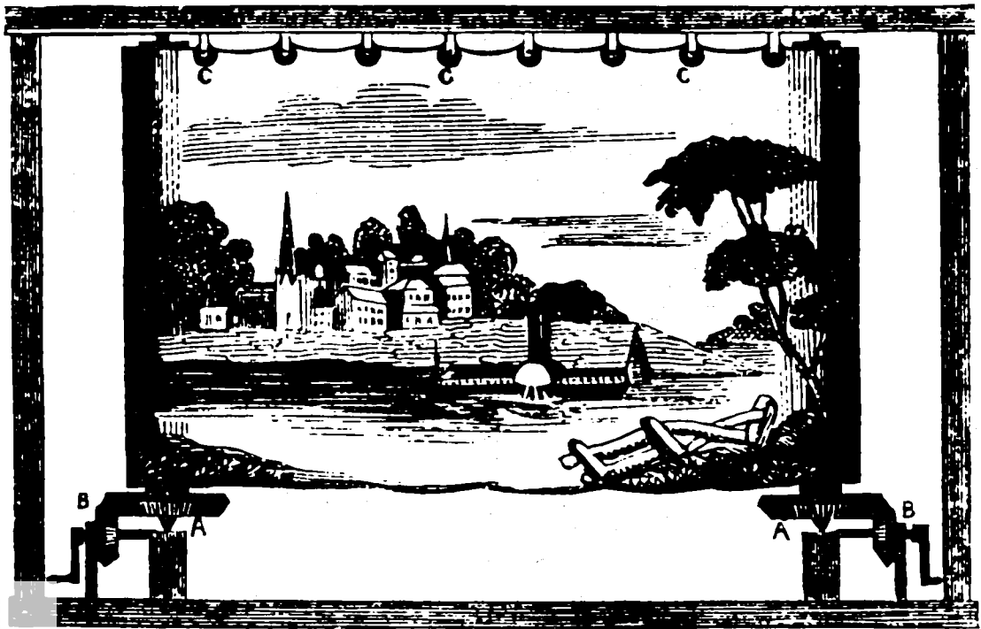
מנגנון ההפעלה של הפנורמה הנעה, כפי שהוסבר בכתב־העת Scientific American מיום 16 בדצמבר 1848

בשנות הארבעים הופיעה לראשונה בארצות־הברית הפנורמה הנעה, שהפכה לאחת מצורות הבידור האהודות על הקהל האמריקני. הפנורמה הנעה היתה אחת מאבות סרט הקולנוע, והשם שניתן לה — 'moving pictures' — נלקח לאחר־מכן לתיאור סרט הקולנוע. 5 הפנורמה הנעה הראשונה על ארץ־ישראל הוכנה על־ידי צייר אמריקני בשם ג'והן בנוורד (Banvard, 1815-1891). בשנות השלושים עבד כצייר־דיוקנאות לאורך נהרות האוהיו והמיסיסיפי, מן העיר סינסינטי עד לניו־אורליאנס. בשנת 1840 החל לשוט בסירה על־פני נהר המיסיסיפי וצייר מאות רישומים. מן הרישומים האלה הכין פנורמה של נהר המיסיסיפי על יריעת־ בד ענקית. משערים, שאורכה היה כ־1,000 מ' וגובהה כ־7.5 מ'. בשנת 1846 לקח בנוורד את הפנורמה לסיוור־תצוגות ברחבי ארצות־הברית וזכה להצלחה גדולה. בסתיו 1848 הביא בנוורד את הפנורמה ללונדון והציגה שם גם בפני המלכה ויקטוריה וחצרה. לאחר שהציג את הפנורמה בערים