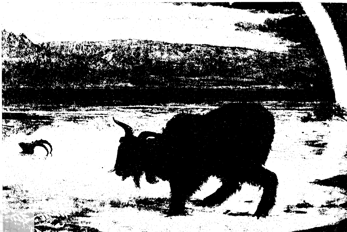
ויה הנט, השעיר לעזאזל, שמן על בר, 1855. גלריה לאמנות, מנצ'סטר

סיפור התנ"ך, היו משליכים את השעיר לעזאזל אל 'המדבר' מצוק בירושלים. בתוקף האמת לטבע' שאליה שאף, היה הנט אמור לצייר פגר מוטל במדבר, או גל-עצמות. שהרי התיש האומלל היה שובר את מפרקתו כבר על מדרון הרי יהודה, לפני הגיעו לחופו של ים-המלח. אולם הנט הציג בצירו תיש חי, שבייסוריו מסמל את ישו הנוצרי.