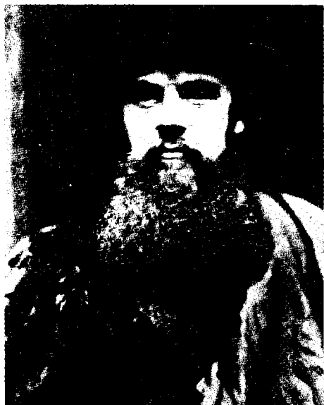
ויליאם הולמן הנט, 1827-1910 (צילום משנות השישים)

הצייר האנגלי ויליאם הולמן הנט (Hunt, 1827-1910), הגיע לראשונה לארץ-ישראל בשנת 1854, ואחר-כך שב וביקר במזרח ב-1869, 1875 ו-1892. המניע לביקוריו היה רצונו להכין סדרת תמונות המוקדשת לאירועים מחייו של ישו.