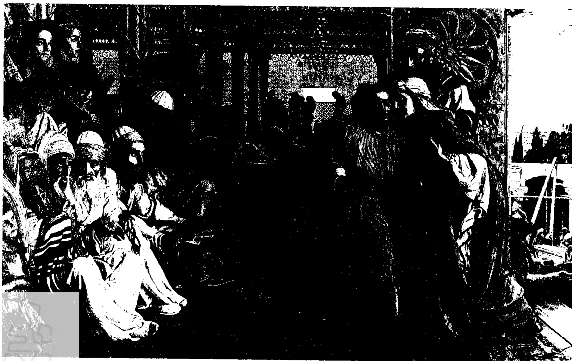
ר"ה הנט, הימצאו של המושיע בבית המקדש, ציור שמן על בד, 1860. מוזיאון וגלריה לאמנות, בירמינגהם. כדוגמנים לציורו שימשו יהודים ירושלמים בני עדת הספרדים. את דמות ישו צייר הנט לפי דמותו של נער אנגלי בלונדון

בדמותו של שה, חיית הקרבן בפולחנים הדתיים של המזרח הקרוב (כולל היהדות). בהמתו של השה המסורתי בתיש ביקש הנט להתאים את פולחן הכפרה היהודי למסר הנוצרי שרצה להביע בתמונתו. הוא הוסיף עומק לסמליות התיש באמצעות קשת כשמים, בצדה הימני של התמונה, המסמלת את בריתו של אלוהים עם נח. המסר הסמלי של התמונה מבוסס אפוא על הנגדה של הברית החדשה עם זו הישנה: בריתו של אלוהים עם נח (נציגה של האנושות כולה) נכשלה, כמו גם בריתו עם היהדות; הברית החדשה — בריתו המחודשת של אלוהים עם האנושות באמצעות ישו, הקרבן, היא אשר תביא את הגאולה לכל אדם המבקש להאמין בו.