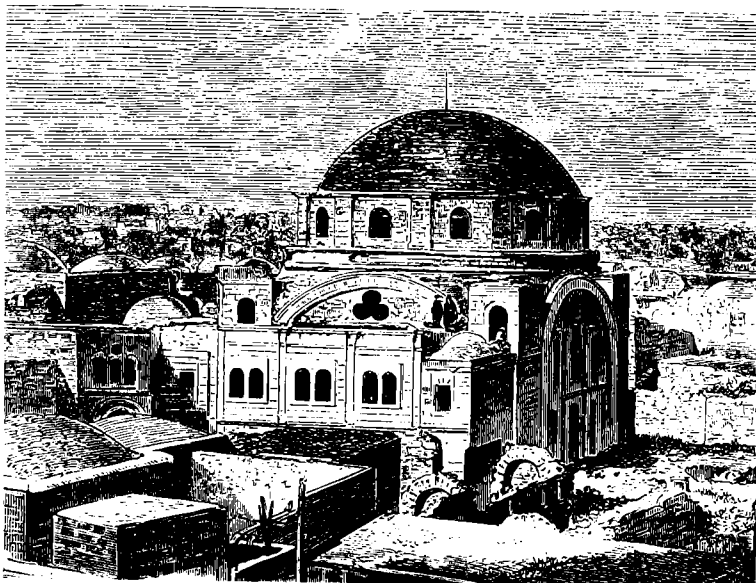
בית-הכנסת 'בית יעקב' (חורבת ר' יהודה חסיד), אחרי השלמת בניינו בשנת תרכ"ה (1865)

לעת, בין היתר בנימוקים שאין הכולל נושא באחריות לתפקודו הלקוי של ר' ישראל משקלוב. בצוואתו ביקש ר' ישראל משקלוב להבטיח את פרעון החובות האלה, אך גבאי ארץ-ישראל בוילנה לא נטו להשתדל ביותר בעניין זה, כפי שניתן ללמוד בעקיפין מדברי לעהרן. 30 באיגרת-תשובה לגבאים בוילנה התריע לעהרן עוד: