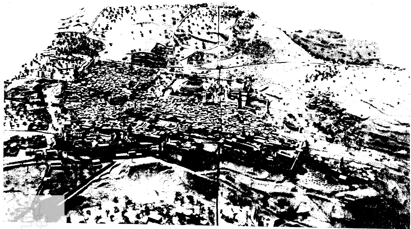
מפת התבליט של אילש אשר שימש כנראה מקור לציור המפה

הצמחיה, בתי הקברות, בריכות המים וכד'. נוסף לכך, הודגשו הקונסוליות באמצעות דגלונים והכנסיות באמצעות צלבים. תשומת-לב ניכרת הוקדשה לבנייני-ציבור, ובעיקר לבניינים של מוסדות אירופיים-נוצריים. כך בולטים ההוספיס האוסטרי, מגרש-הרוסים, הפטריארכיה הלאטינית, כנסיות הרובע הארמני ועוד.