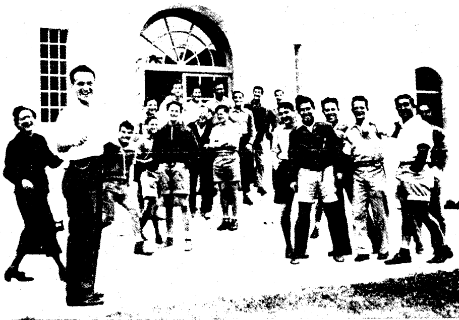
חצר בית-הספר בשנה הראשונה

המדינית) מכתב אל מזכירות הממשלה והאיץ בה לפעול ולהודיע במהרה על תאריך פתיחתו של בית-הספר. 71