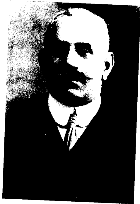
סיר אליס כדורי (1865-1922)

הוסיף, כי כבר יש לי, כפי שידוע לך, בית ספר גדול מאד בבגדד, שערכו הוא למעלה ממאה אלף לירות ובו לומדות למעלה מ-1,500 בנות. 8 ההנחה המוטעית, כי על-פי הצוואה יועבר הכסף לממשלת ארץ-ישראל, נשארה אפוא בתוקפה. כדורי החל לדון על כך עם הנציב העליון, הרברט סמואל; הוא הניח, מן הסתם, כי ממשלת המנדט היא שתטפל בעניין. בכך אישש עוד יותר את ההנחה הזאת, הן אצל סמואל והן אצל ראשי היישוב היהודי. עם זאת, הוא עדיין סייג במידת-מה את סמכויותיה של ממשלה זו, בכתבו לסמואל כי הסכומים יועמדו לרשות מפעל בניית בתי-הספר, כאשר נאמני העזבון — היינו, הוא עצמו — יווכחו שהתכנית אושרה על-ידי הממשלה הבריטית. הוא עוד הוסיף תנאי, כי הבנייה תיעשה על-ידי יהודים, בפיקוח ממשלתי. 9 נראה אם כן, שבכך פירש אלי כדורי את צוואת אחיו, כי הכסף יוקדש לבניית בתי-ספר עבריים בארץ-ישראל. אך לא חלף זמן רב והוא נסוג מעמדתו זו. בינתיים, הוחל בצעדים מעשיים למימוש הכוונות. וייצמן פנה אל הרברט סמואל וביקשו, לאור העובדה שהכסף יעמוד לרשותו, לקבל את יושב-ראש ההנהלה הציונית בארץ-ישראל, מנחם אוסישקין, שיעלה בפניו הצעות שונות באשר לאופן השימוש בכסף. 10