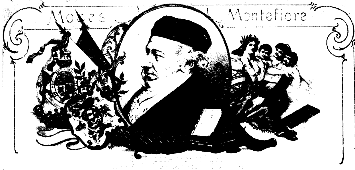
גלוית־דואר מהנאו, גרמניה, הנשאת את דיוקנו של מונטיפיורי וסמל משפחתו

'צונזרה' ביומני הנדבן ורעייתו שפירסם מזכירו לווה בשלהי המאה הי"ט. 10 בשנות החמישים ובשנות השבעים נפגשו שוב דרכי מונטיפיורי עם חוזים נוצרים, שחפצו להקים מושבות חקלאיות בארץ־ישראל, כשלב בדרך לשיבת היהודים ולגאולה השלמה: בפרשת 'פרדס מונטיפיורי' 11 ובהצעותיו של ג'ורג' גאולר שזכו לפרסום רב בעיתונות היהודית באמצע שנות השבעים. 12 אין כל ספק, כי היותו של מונטיפיורי במוקד פעילות נוצרית־משיחית השפיעה באופן כלשהו על תמורות בזיקת היהודים לארץ־ישראל. אישיותו ופעילותו היוו גשר בין המתח המשיחי הנוצרי של ימי הכיבוש המצרי בארץ־ישראל בשנות השלושים למגעים שבין מבשרי 'חיבת ציון' ומילנאריסטים אנגלים בשנות השבעים.