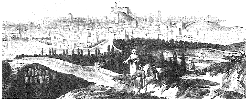
חלב — מראה כללי של העיר בסוף המאה הי"ח — תחריט זה והתחריט בעמ' 58 מתוך: A. Russell, The Natural History of Aleppo (London 1794)

כלל לשמש כדיינים. הרוב היה מוכן למנות אדם שלא היה ראוי למשרה נכבדה זו, אבל המיעוט עירער על כך ופנה אל רב כדמשק שתמך בעמדתו. 11 אם האיטיות המעורבת בפולמוס מעין זה היתה בעלת 'קשרים' כגון בנקאי של הפחה (צראף), קונסול או 'חכם באשי', אזי, לעתים, הופנתה עוצמת המדינה כנגד מנהיגי הקהילה. ההכנסות של הארגונים הקהילתיים באו מכמה מקורות: ממכירת בשר כשר, ממסים שנקבעו לפי הערכה ה'זועדה', מתרומות מנדרים בעת עלייה לתורה ובהזדמנויות אחרות וכן מקנסות. ממלחמת-העולם הראשונה ואילך מומן חלק גדול של התקציב הקהילתי מכספים שנשלחו מיהודים יוצאי-סוריה שהיגרו לחו"ל. בימי שמחה, בט"ו באב או בל"ג בעומר, נערכו חגיגות-ערב ובהן נתרמו תרומות. בהזדמנויות אלה נתרמו הכספים לחברות-צדקה — כמו: חברה קדישא, 'אחיעזר' — לאספקת מזון והלבשה לעניים, חברת 'שמע ישראל' — לנדוניות של בנות-עניים, 'תלמוד-תורה', ביקור-חולים — וכן לצרכי בית-הכנסת. מקור-הכנסה אחר למוסדות הקהילתיים היה ה'הקדש' (בערבית 'ואקף'), שבעליו הקדישוהו למוסד או למפעל בעל אופי דתי, כגון אדם שהיה מקדיש את כל דמיה-שכירות מבניין השייך לו לכית-הספר. אירע בדמשק שבן ערער על צוואת אביו, משום שהוקדש בה כסף למטרה מעין