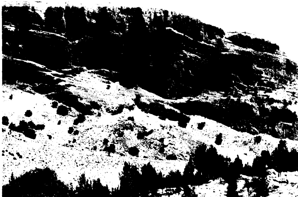
סלע עכברה' – המצוק בנחל-עכברה והמערות שבו. למרגלות המצוק – חורבת סלע

והגישה אליו קלה ונוחה מכל הכיוונים. משלחת שעסקה בסקר ובחפירות בגליל שמה לבה לעובדה זו, וחבריה יצאו לחפש את ביצורי עכברה על-פני הרמה המשתרעת מעל הכפר, ממזרח לו. 31 ברמה שטוחה וסלעית זו לא נמצאו כל שרידים ארכיאולוגיים, מלבד ח'אן ערבי קטן. מכאן באו חברי המשלחת למסקנה קיצונית, כי יוסף בן-מתתיהו לא ביצר כלל את עכברה; ולפיכך יש לשאול, האם אכן היו קיימים כל הביצורים שהוא מזכיר?