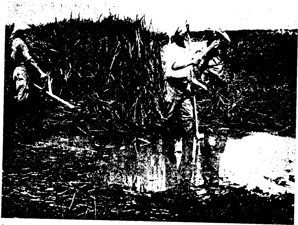
קצירת הסוף בביצות עמק-יזרעאל

אחוז מהאדמות לא היו אדמות-ביצה. לעומת זאת, באזורים אחרים בארץ, כגון בזכרון-יעקב או במפרץ-חיפה, היקף הביצות היה גדול פי כמה הן יחסית והן בשטחן הכולל. פיקרד, שחקר את בעיית מי התהום בעמק-יזרעאל למן התקופה שלפני יבוש הביצות (קידוחים בעמק בזמן מלחמת-העולם הראשונה ואחריה), מציין כי מי התהום מופיעים במספר שכבות בעמק, המצויות עשרות מטרים מתחת לפני הקרקע. הוא אינו מציין במחקרו את הביצות כתופעת-לודאי למי-תהום גבוהים, כפי שמקובל לחשוב. בפתחה לעבודתו כותב פיקרד על המניע לחקירותיו: 'יקר לי הדבר כי אותו העמק משמש סמל לאחדותם הגופנית והרוחנית של הכוחות היוצרים בארץ, והוא כעין לב של ארץ-ישראל החדשה, שמש גם יחד אבן הפינה של החקירה הגיאולוגית המודרנית בארצנו'. 15 יוסף וויץ, אף הוא מראשי הקרן-הקיימת-לישראל, סיכם את סיפור הכשרת הקרקע בארץ-ישראל עד תחילת שנות השבעים. 16 בפרק המוקדש למייבשי הביצות בעמק-יזרעאל הוא מביא את דברי שמואל דיין שהבאנו לעיל, ומספר על הבעיות שהיו קשורות ברכישה ובעבודות הכשרת הקרקע בעמק. וויץ מונה את שמות כל הביצות בנהלל ובנוריס. 17 מעניינת העובדה כי בפרקים על חדרה, בית-שאן, עמק-זבולון מביא המחבר את מפות 'הקרן