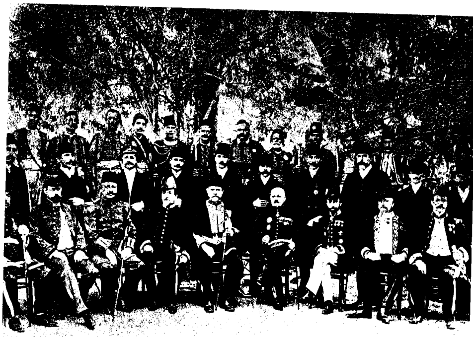
הקונסולים הזרים ביפו ושומרי ראשם בסוף המאה הי"ט

של הקונסול, 'האיש במקום', שבכוח יוזמתו יכול היה להניע את גלגלי הפעילות הדיפלומאטית ולהגביר את הלחץ על 'השער העליון'. אין עדיין בידינו מלוא הידיעות על הפעילות הדיפלומאטית בקושטא, שכן עד כה נחקר חלק קטן בלבד מארכיוני השגרירויות הזרות שבתורכיה, וידיעותינו על פעילות זו נשענות בעיקר על העתקי מכתבים בארכיונים הקונסולאריים ועל ההתכתבות שבארכיונים של משרדי החוץ. המצב טוב יותר לגבי הקונסוליות בירושלים, אם כי גם בהן רב החומר שטרם נחקר. מכל מקום, עליימוד החומר הידוע עד כה, ניתן לתאר בקווים כלליים את הפעילות הדיפלומאטית במערכה נגד גזירות הממשל ואת תוצאותיה החיוביות.