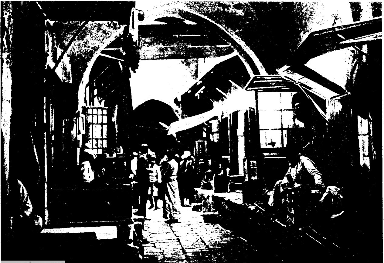
אחד משלושת השווקים במרכז ירושלים, בראשית המאה

אמר [כשהוא מורה] בידו בצורה כזו [?] זה להם וזה להם, כלומר לנוצרים וזה מותר לנו [לקחתו]; והכוונה לשוק האמצעי אשר בין שני הטורים, כלומר השוק הגדול, שבו היתה כיפת העופרת. 8