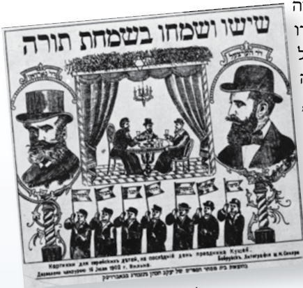
דגל שמחת תורה מרוסיה, 1903

דיוקנו של הרצל היה לאורך המחצית הראשונה של המאה ה-20 הסמן החזותי המובהק ביותר ללאומיות העברית החדשה בארץ, כמו גם בכל רחבי העולם היהודי-הציוני. הדיוקן היה בבחינת הצהרת זהות: רכישת מוצר שעליו דמותו של הרצל הפכה מעין רכישת חלק ושותפות בסיפור הציוני, והצבת תמונתו הגדירה את המרחב כולו כמרחב ציוני. וכך, בצד בית הספר לאמנות "בצלאל" בירושלים ומערך ההפקה וההפצה של הקרן הקימת, הפיקו פריטי גרפיקה ואמנות רבים שעוטרו בדיוקן המוכר של הרצל, פעלו גם סוכני תרבות רבים ולא רשמיים. אלה הפיצו את מראהו של הרצל ברבים משיקולים מסחריים, אך גם מתוך אהבה, גאווה והזדהות עם המנהיג ועם חזונו.