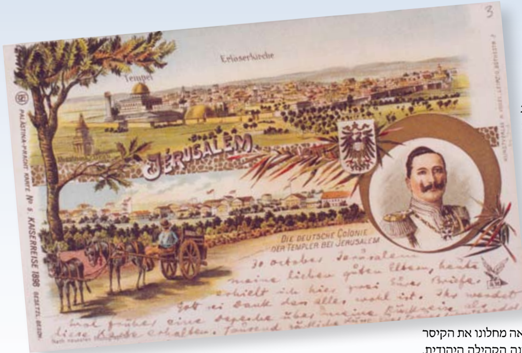
גלויה ששלח הרצל להוריו מירושלים

והנה הגיעו אל המאהל, בשולי רחוב הנביאים של ימינו. לאחר בדיקות מתישות נכנסו וניצבו מול אחד האישים החזקים בעולם. כשחקן בהצגת הבכורה ניצב הרצל, נרגש אך בטוח, מכבד אך לא מתרפס, וכמנהיג של אומה עתיקה נשא דברו בעוז ובריטוט.