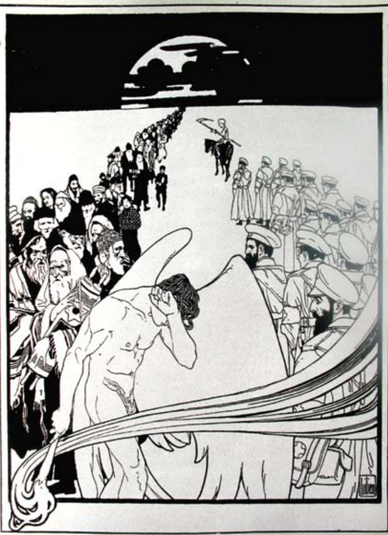
חיילים בדמות הרצל מול זקנים יהודים ("אבות ובנים", א"מ ליליין, 1904)

הכוונה כיצד לעזור למשמר הירדן. מכתבם של הרצל וחבריו אל הרב נכתב הפעם בעברית: "מדעתנו כי נהירין לו דרכי הרעיון והליכותיו עד כה, הננו מבקשים עצה מפיו, יען כי הוא הצעד הראשון שאנו עושים בעזרת השם בענייני היישוב ואין אנו בקיאים כל כך ומתיירים אפוא לבל נכשל חס ושלום במפעלנו זה".