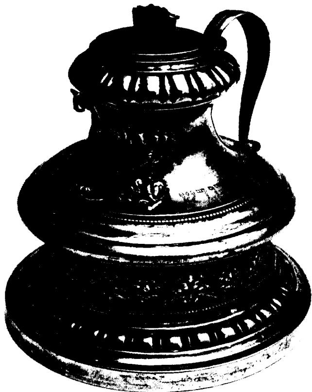
קופסת-צדקה עשויה כסף רקוע בצורת בסיס של מנורה. נעשתה בווינה, 1834

חזרה לאירופה, כדי לארגן תמיכה עבור העולים. 8 הוא קבע 'מעמדות', כלומר התחייבויות אישיות לתרום סכומים קבועים — אם פעם בשבוע ואם פעם בשנה — עבור היושבים בארץ הקודש. לאחר פטירתו, בסביבות שנת 1783, עמד ר' שניאור זלמן בראש מגבית זו. כבר ב-1781 חתמו ר' ישראל מפאלאצק, ישכר בער סג"ל ור' שניאור זלמן על גזירה האוסרת שימוש בכספים שנאספו למען עניי ארץ-ישראל לצורכי צדקה מקומיים, והוסיפו: