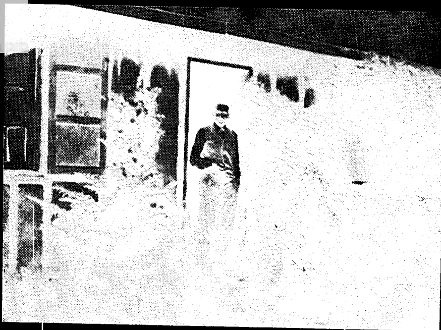
יצחק בן צבי בפתח הצריף